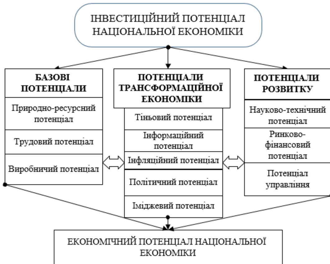
Рис. 1. Інвестиційний потенціал національної економіки країни у трансформаційній економічній системі