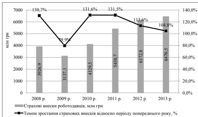
Рис. 2. Динаміка надходження страхових внесків роботодавців і темпи зростання відносно періоду попереднього року

Згідно зі звітом про виконання бюджету Фонду за 2013 рік, дохідна частина виконана на 97,9%, це пов'язано з недоотриманням суми поточних надходжень на 136 462,6 тис. грн, або 2,1%, хоча передумов для цього не було, оскільки протягом 2012–2013 років спостерігалось збільшення кількості платників на 56 315 осіб, або на 3,5%, що мало б збільшити надходження до бюджету Фонду. Причиною цього є відсутність контролю за сплатою та надходженням внесків до Фонду, що створює передумови для накопичення заборгованості по сплаті страхових внесків. Отже, в загальному підсумку у 2013 році бюджетом Фонду було недоотримано 144 724,1 тис. грн, або 2,2% внесків фізичних та юридичних осіб (табл. 2) [11].