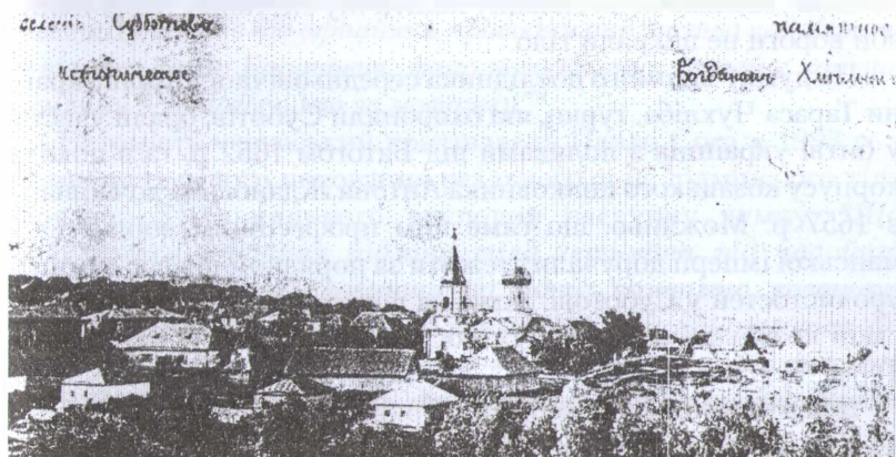
Панорама Суботова з видом на Михайлівську церкву.