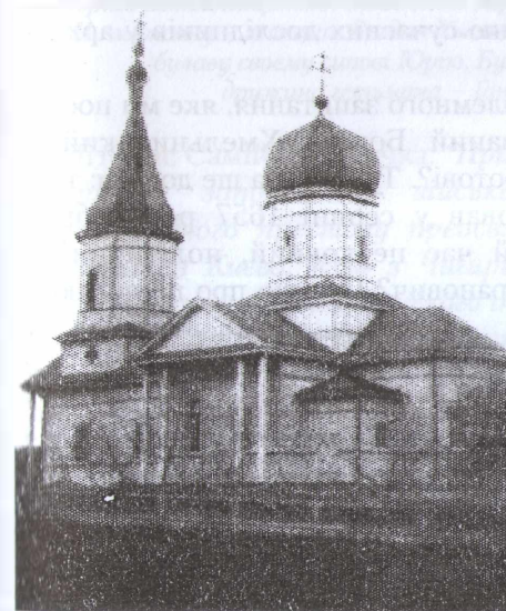
Михайлівська церква у Суботові. 1912 р.

Чи міг бути похований гетьман України Богдан Хмельницький у дерев'яній Михайлівській церкві в Суботові?