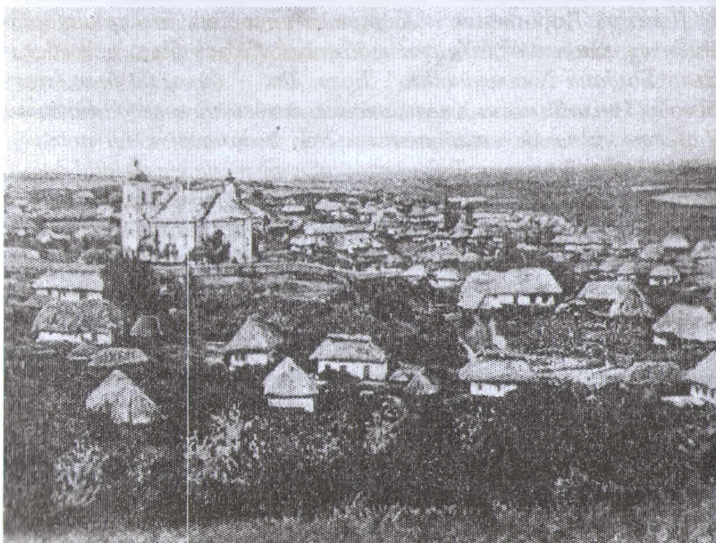
Панорама Суботова на час перебування Д.Дорошенка.

І тут ще можна припустити, що поховання Богдана Хмельницького було здійснено у Михайлівській церкві, “у церкві, що він сам будував”, як зазначає Микола Аркас, якщо