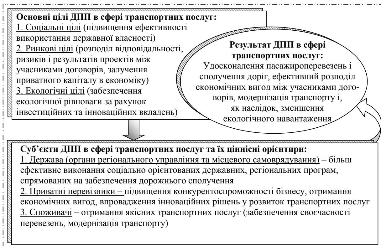
Рис. 2. Формування і розвиток ДПП в сфері транспортних послуг

Причому основним завданням ДПП у цьому випадку є нівелювання суперечностей, що виникають між соціальним та ринковим середовищем: з одного боку, державно-приватні партнерства