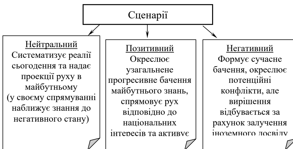
Рис. 3. Вірогідні сценарії розвитку системи знань регіонального інформаційного менеджменту

Наведені сценарії окреслюють авторську думку, є узагальненими та виділяють, головним чином, вектори розвитку, але вони в першу чергу наголошують на зацікавленості науковців регіонального менеджменту в оцінках і потребах балансування та консолідації національних, регіональних, соціальних та економічних інтересів (рис. 3) [11].