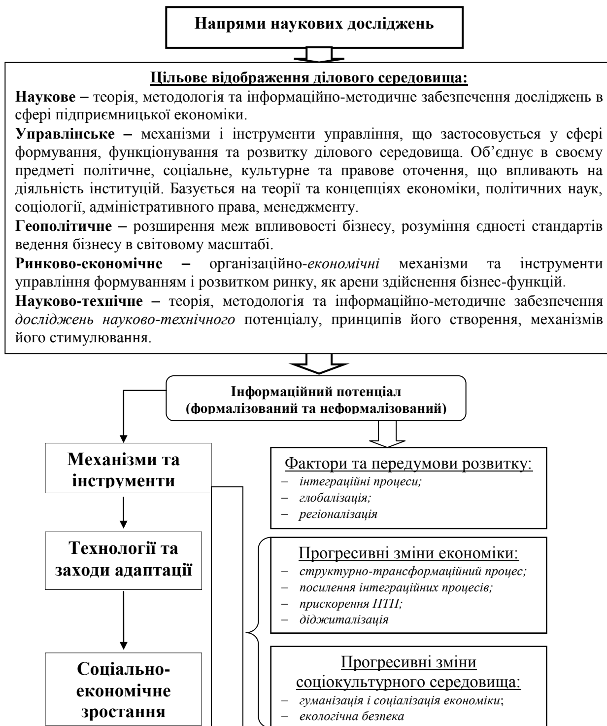
Рис. 3. Цільове відображення ділового середовища в наукових дослідженнях