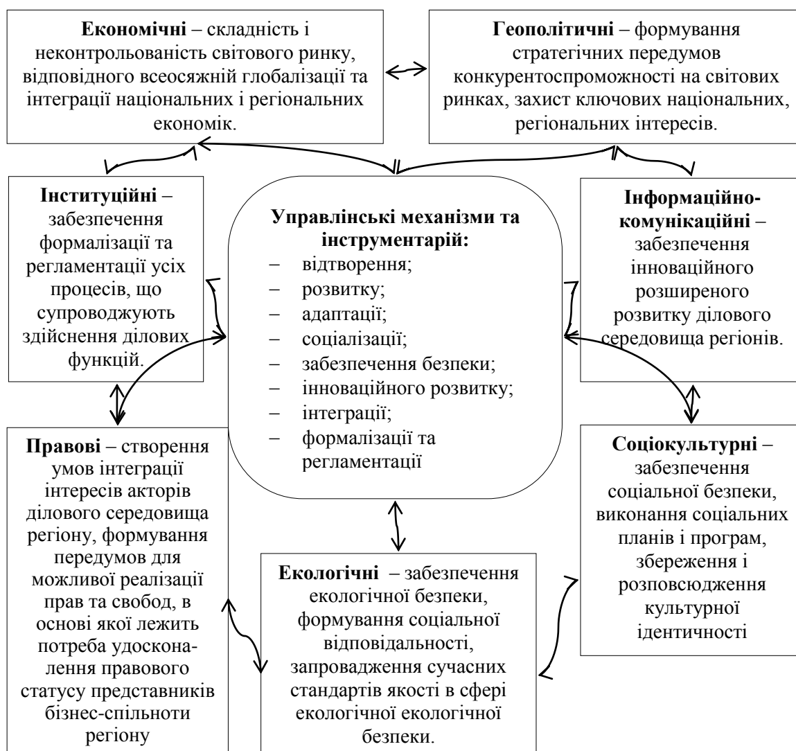
Рис. 2 Формалізація інтересів як рушійної сили розвитку ділового середовища регіону

Регіональні інтереси, необхідно вивчати з позиції їх пріоритетності для національної економіки, формування здорового ділового середовища регіону (рис. 2).