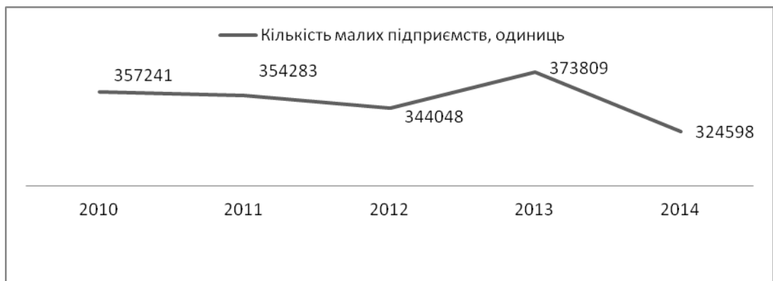
Рис. 2. Динаміка кількості малих підприємств в Україні

Ще одним підтвердженням важливості малого підприємництва у економіці України є його питома вага. Малі підприємства України у 2014 році склали 95,19% від підприємств у цілому. І цей показник є на 0,92% вищим, ніж на Черкащині. Для порівняння динаміки питомої ваги малого підприємництва на Черкащині та в Україні розглянемо рис. 3.