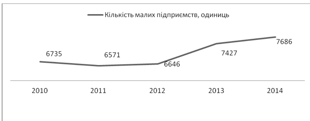
Рис. 1. Динаміка кількості малих підприємств у Черкаській області

Визначаючи тенденції розвитку малих підприємств у Черкаській області, перш за все, проведемо аналіз зміни кількості суб'єктів ЄДРПОУ, що зареєстровані в відповідних статистичних органах як Черкаської області, так і України в цілому. Варто відзначити, що загальна кількість підприємств Черкаської області складає 2,39% від кількості підприємств України. Щодо малих підприємств Черкаської області, то вони складають 2,37% малих підприємств України. За даними Головного управління статистики в Україні [4] стан малого підприємництва України характеризується нерівномірною динамікою кількості малих підприємств за останні п'ять років. Що ж до стану малого підприємництва в Черкаській області, то за даними Головного управління статистики в Черкаській області [5] спостерігається рівномірна динаміка зростання кількості малих підприємств за останні роки. Кількість малих підприємств Черкаської області й України представлено відповідно на рис. 1 та рис. 2.