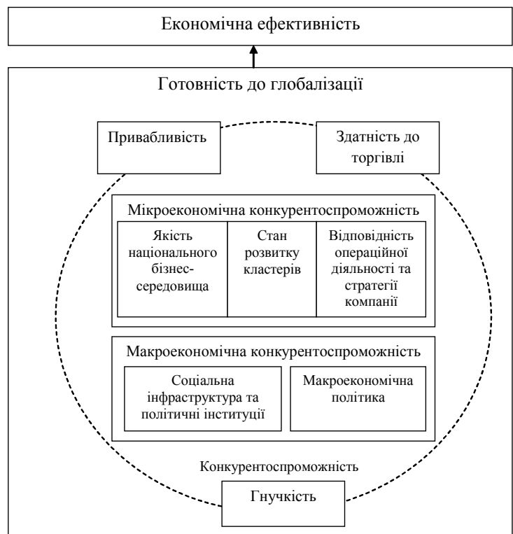
Рис. 1. Фактори, що визначають готовність країни до глобалізації

декілька суб'єктів господарювання досягають певної конкурентоспроможності, вони розповсюджують свій вплив на інших агентів: конкурентів, постачальників,