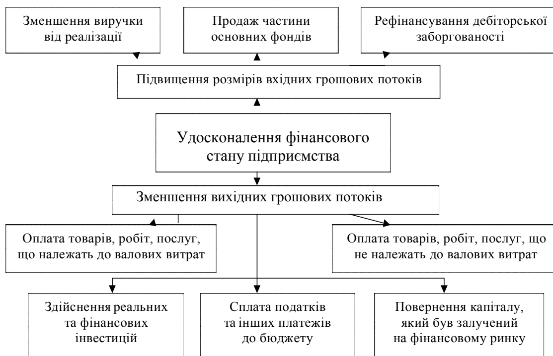
Рисунок 1 – Шляхи удосконалення фінансового стану підприємства