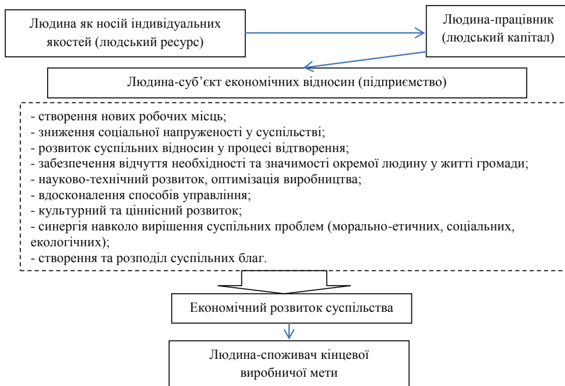
Рисунок 2 – Трансформація ролі людини у забезпеченні економічного розвитку суспільства

На рисунку 2 зображено авторське бачення ролі людини у формуванні та використанні людського капіталу у контексті досягнення економічного розвитку суспільства.