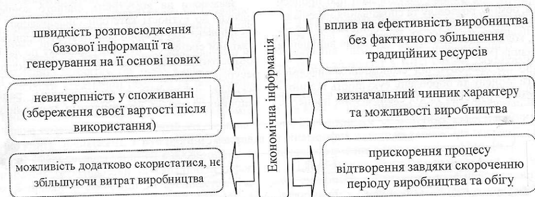
Рис. 2. Характерні особливості економічної інформації в умовах інформаційної економіки

Висновки. Отже, використовуючи поширені у наукових колах підходи до трактування категорії «інформація» залежно від форм прояву, її варто розглядати як: дані (повідомлення) економічним агентам, які цього потребують; структуруючий елемент економіки; елемент ІКТ. При цьому варто окремо розглядати термін «економічна інформація» як сукупність відомостей, що характеризують стан використання (обробки) даних у господарській діяльності відповідно до рівня розвитку виробничих чинників та сформованих економічних відносин. Відповідно, можна виокремити такі характерні особливості економічної інформації в умовах інформаційної економіки: швидкість розповсюдження, невичерпність у споживанні, можливість додатково скористатися без збільшення витрат виробництва, визначальний чинник характеру та можливості виробництва. Своєю чергою, це може бути теоретичною основою для розроблення стратегії забезпечення розвитку інформаційної економіки, що є перспективою подальших досліджень.