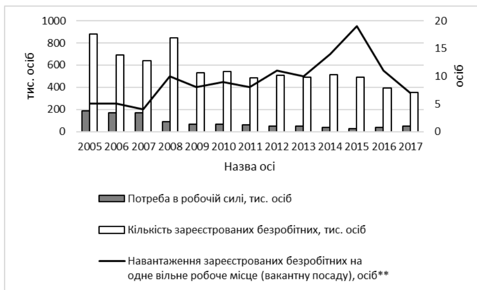
Рис. 2. Динаміка деяких показників, що відображають попит і пропозицію праці в Україні, 2005–2017 роки (дані з 2014 року – без окупованих територій)

Аналіз показника потреби в робочій силі потребує також професійного розрізу. Український ринок праці зберігає дефіцит на низку професійних груп фахівців при одночасній праценадлишковості робочої сили. Однією з причин такої ситуації є постійно висока міграційна активність населення та задовільні умови зайнятості для низки професій, зокрема високого соціального значення (медики, освітяни тощо).