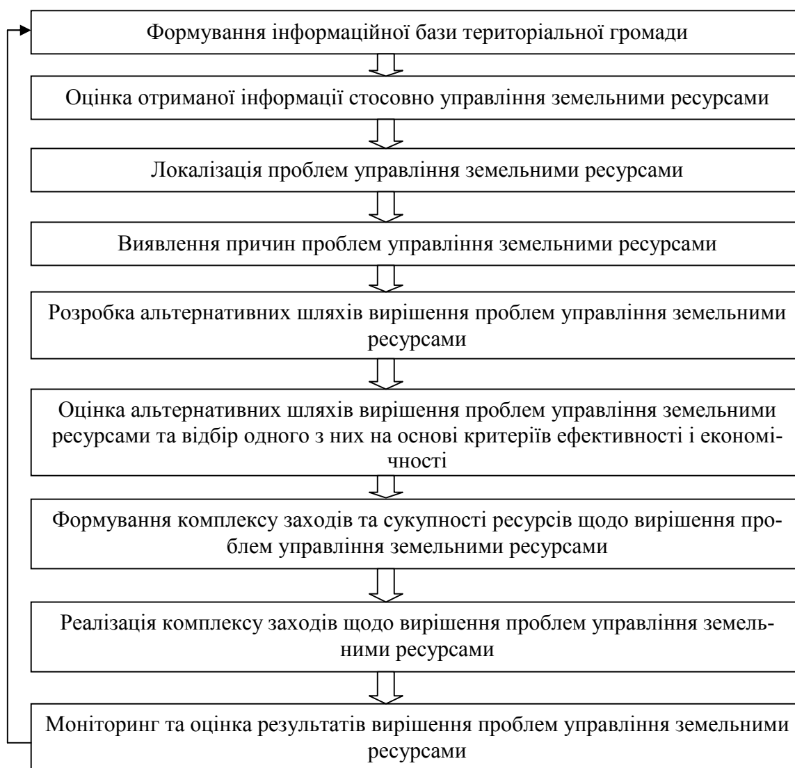
Рис. 2. Алгоритм вирішення проблем управління земельними ресурсами територіальних громад в Україні