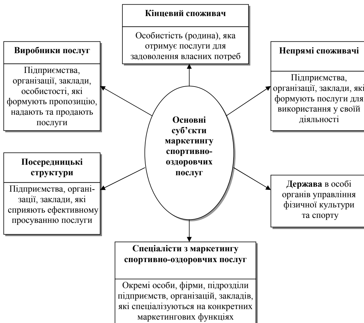
Рис. 1. Основні суб'єкти маркетингових відносин у сфері спортивно-оздоровчих послуг

Можна виділити наступні основні проблеми маркетингової діяльності підприємств спортивно-оздоровчої спрямованості [4]: