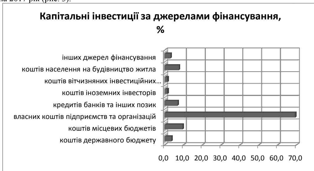
Рис. 3. Розподіл капітальних інвестицій за джерелами фінансування у 2017 р.

Ретельним повинний бути й аналіз капітальних інвестицій за джерелами фінансування. За статистичними даними (млн. грн.) була обчислена частка кожного з джерел фінансування (у відсотках) станом на 2017 рік (рис. 3).