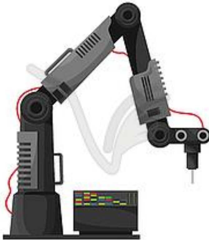
Рис. 1. Зварювальний маніпулятор

У доповіді розглядається чисельне моделювання у складі САПР роботи зварювального маніпулятора разом з блоком керування при виконанні зварювальних швів заданих конфігурацій.