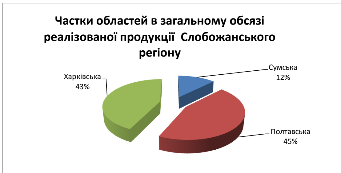
Рис. 3. Середні значення (за період 2010–2017 рр.) частки Харківської, Полтавської та Сумської областей в загальному обсязі реалізованої промислової продукції (товарів, послуг) Слобожанського регіону

Результати проведеної різними методами кластеризації виявилися аналогічними. Харківська та Полтавська області вносять майже однікові частки в загальний обсяг реалізованої промислової продукції Слобожанського регіону – 43 % та 45 % відповідно (рис. 3).