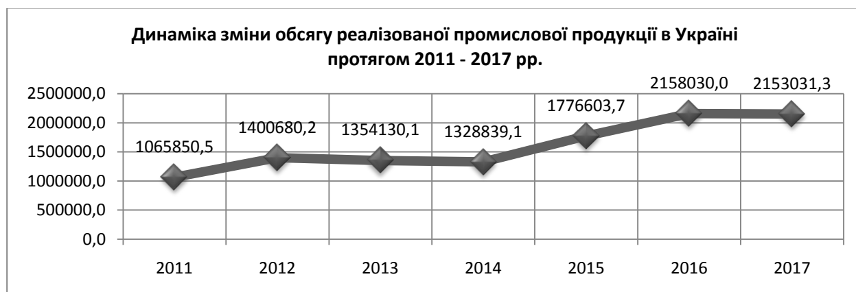
Рис. 1. Динаміка зміни обсягу реалізованої промислової продукції в Україні протягом 2011–2017 рр.

Розвиток окремих промислових комплексів України пов'язаний із особливостями географічного розташування, наявністю корисних копалин, науково-технічного потенціалу, історично-обумовленими процесами тощо. Для динамічного розвитку регіонів необхідно виділити пріоритетні напрями та побудувати стратегію управління регіональними промисловими комплексами. З метою впровадження політики децентралізації Кабінетом Міністрів України запропоновано проект зміни формату адміністративно-територіального упорядкування. Згідно даного проекту планується три рівні розподілу – регіон, район, громада.