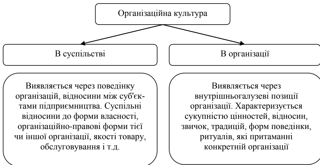
Рис. 1. Характерні особливості прояву організаційної культури

При розгляді організації з точки зору «особистості» необхідно визначити ступінь задоволення потреб стейкхолдерів по ієрархії (рис. 2) [3, с. 22].