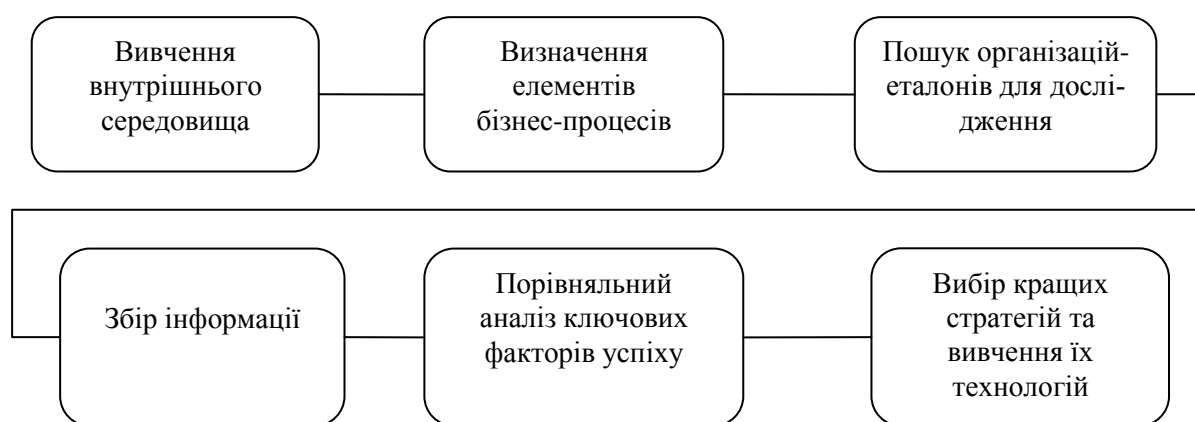
Рис. 4. Процес бенчмаркінгу організації

Нами проведено аналіз побудови моделей впливу керівників в організаційній культурі підприємств України по виробництву молочної продукції в брендівних групах «Молочний альянс», який виявив відсутність планів керівництва по розробці планів комплаєнс-контролю (корпоративного кодексу, кодексу етики та ділової поведінки та кодексу соціальної відповідальності). Схематично процес аналізу представлено на рис. 4.