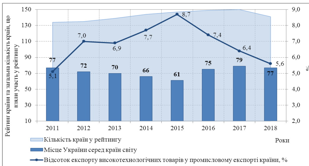
Рисунок 3 – Рейтинг України серед країн світу за відсотком експорту високотехнологічних товарів у промисловому експорті за період 2011–2018 рр.

Протягом періоду дослідження найвищий відсоток витрат на НДДКР до обсягу ВВП в Україні спостерігався у 2000 та 2005 рр. і становив 1,0 %, тоді як найнижчий – у 2017 р. – 0,4 %. Отже, падіння рейтингу України за рівнем цього показника пов'язано зі скороченням більш ніж у два рази його значення за останні 20 років. Продовження означеної тенденції і надалі унеможливить реалізацію проєктів смарт-спеціалізації та стабілізацію економічного стану в країні.