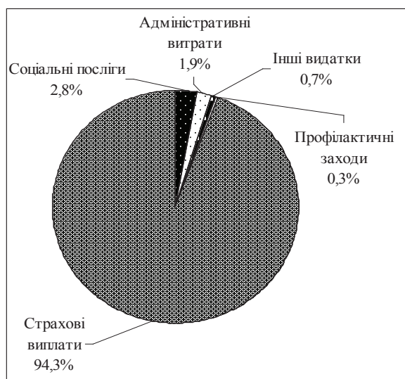
Рис. 1. Структура видатків державних фондів соціального страхування України, 2015 р.*

Доходна частина державних фондів соціального страхування в Україні формується переважно за рахунок соціальних відрахувань. Дослідження обсягів, складу та структури видатків фондів соціального страхування в Україні виявили, що близько 6% припадає на видатки, які за економічним змістом не можна вважати страховим (рис. 1), це профілактичні заходи, адміністративні та інші витрати.