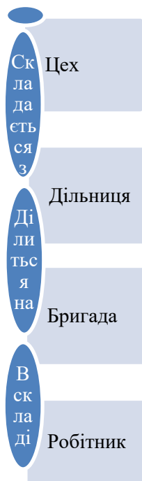
Рис. 1. Схема управління виробничим підрозділом хімічного підприємства

формації. Своєчасне оновлення інформації є достовірним джерелом даних для вирішення комплексу завдань, що пов'язані з виробничим процесом, а також формування системи інформаційних потоків.