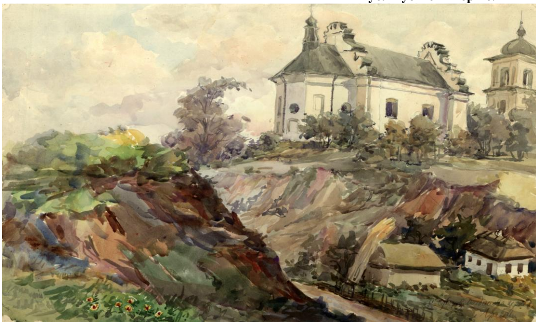
Богданова церква в Суботіві. Вигляд з північного сходу. Малюнок архітектора Г. Логвина. 1947 р. З фонду ДНАББ ім. В. Г. Заболотного. Публікується вперше.