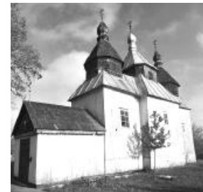
Тарасова світлиця в Каневі