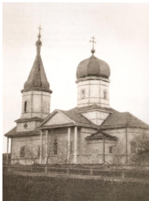
Михайлівська церква у Суботові. Світлина 1912 р.

Відомі й авторитетні українські історики, одні з кращих на сьогодні знавців біографії Богдана Хмельницького, Валерій Смолій і Валерій