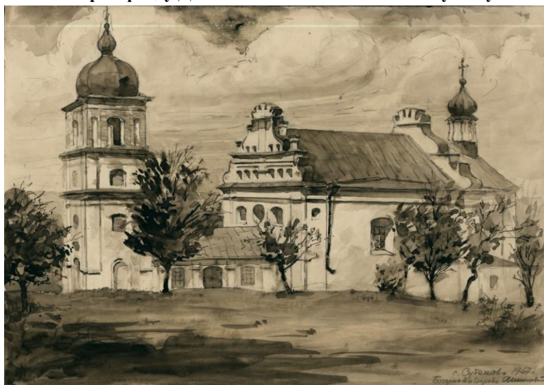
Богданова церква в Суботіві. Вигляд з південного заходу. Малюнок архітектора Д. Яблонського. Логвина. 1947 р. З фонду ДНАББ ім. В. Г. Заболотного. Публікується вперше.