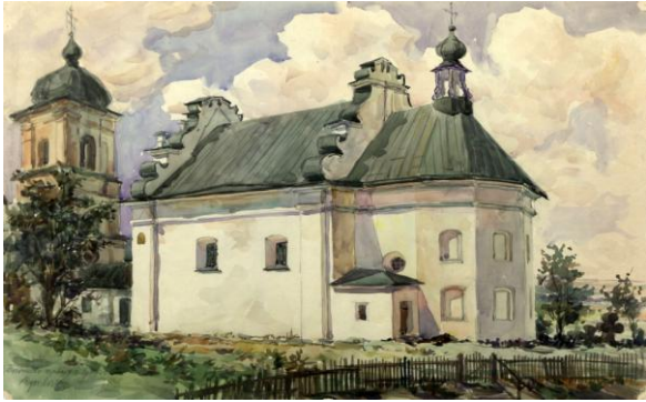
Богданова церква в Суботіві. Вигляд з півдня. Малюнок архітектора Г. Логвина. 1947 р.