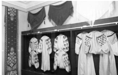
Музей-скансен «Козацькі землі України»