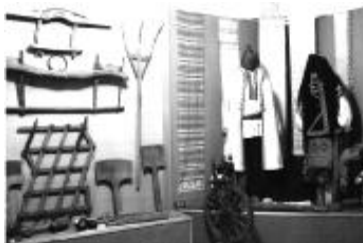
Хата чумака в с. Моринці