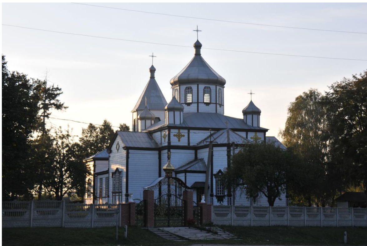
Іл. 1. Церква Святого Архістратига Михаїла (с. Михайлівка)