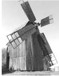
Черкаський обласний краєзнавчий музей