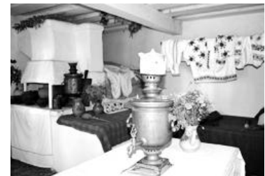
Музей культури і побуту в Умані