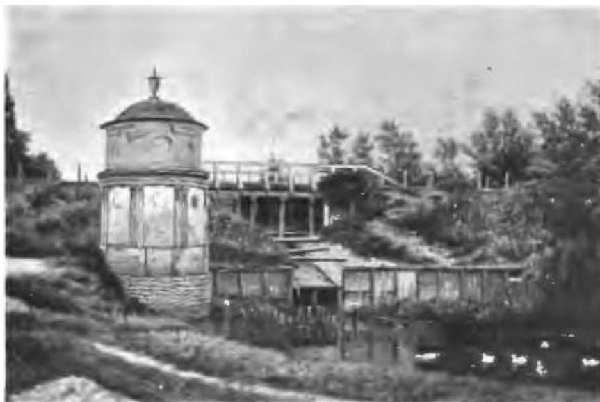
Н. Бунинъ. Историческая мельница въ м. Каменнѣ Киевской губ., гдѣ Шервудъ раскрылъ заговоръ южно-русскихъ Декабристовъ.

Будувався млинок два роки. Він являє собою круглу цегляну двоповерхову башту на високому кам'яному фундаменті з парними пілястрами по фасаду першого поверху. Перекритий млинок дерев'яним куполом і залізним сферичним дахом, що закінчується декоративною прикрасою. Перекриття першого поверху дерев'яне, підлога цегляна [3].