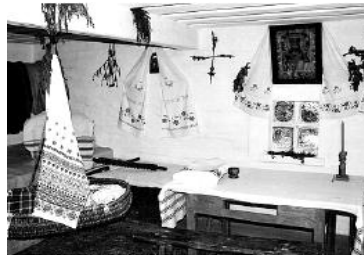
Хата батьків Т. Шевченка в с. Шевченкове