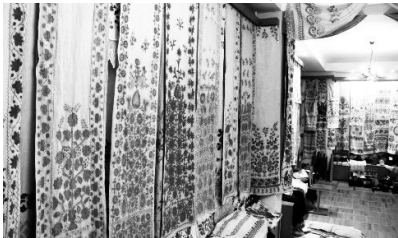
Музей-садиба «Райський куточок»