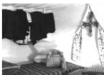
Хата батьків Т. Шевченка в с. Шевченкове