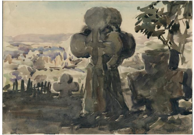
Кам'яні хрести. Малюнок архітектора Г. Логвина. 1947 р. З фонду ДНАББ ім. В. Г. Заболотного. Публікується вперше.