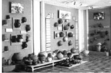
Черкаський художній музей