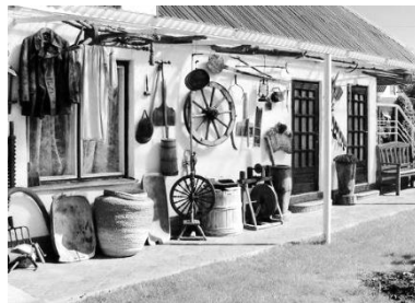
Хата Копія в с. Моринці