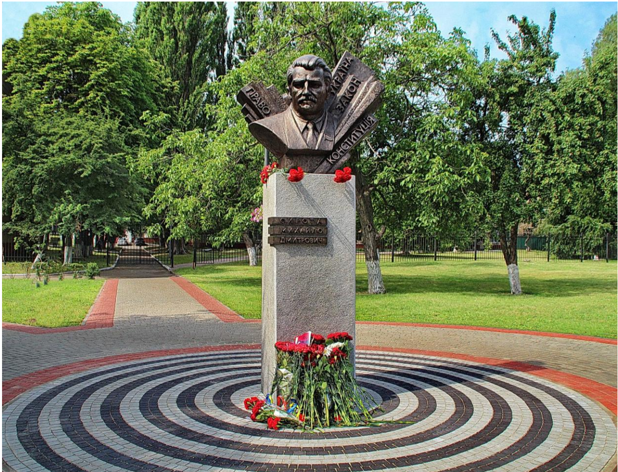
Пам'ятний знак М. Д. Сироті, відкритий 27 червня 2017 р. Площа Знань ЧДТУ. м. Черкаси

Висновки. Отже, провівши історіографічний аналіз, ми можемо ствердно констатувати наступне. Постать М. Д. Сироти і його суспільно-політична діяльність сприяла утвердженню державності України у геополітичному просторі третього тисячоліття. Пам'ять про нього як про визначного державника, науковця, політика, людину увічнено на його малій батьківщині у Черкасах, зокрема у Черкаському державному технологічному університеті, де він навчався і працював. Місцева влада, освітяни і громадськість міста вшановують пам'ять про «батька української Конституції» на урочистостях до свят і пам'ятних дат, покладаючи квіти до спорудженого пам'ятного знака М. Д. Сироті на Площі Знань.