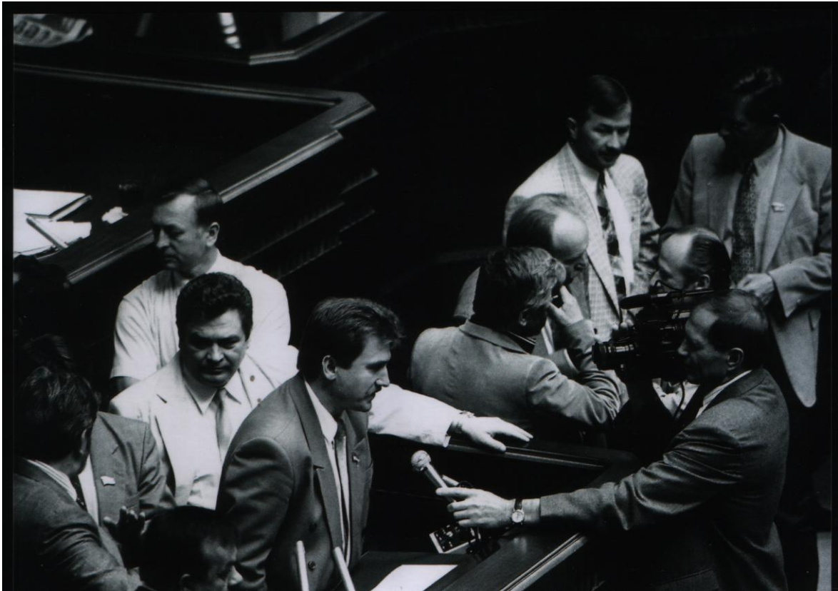
У вирі прийняття Конституції України. 1996 р.

Було й так, що я тримався за трибуну обома руками, а на моїх плечах чоловік 5-10 висіли, шпурляли один одного, били. Це була боротьба добра і зла, нечистих сил і Божої світлої сили. Як викладач я використав звичний прийом. Стоячи на трибуні, я не бачив облич, бачив лише чорну силу, яка кипіла ненавистю. Виходячи на трибуну, я хрестив тричі залю поглядом, а не рукою, і читав про себе «Отче наш». Після того нікому не вдавалося вивести мене з рівноваги.