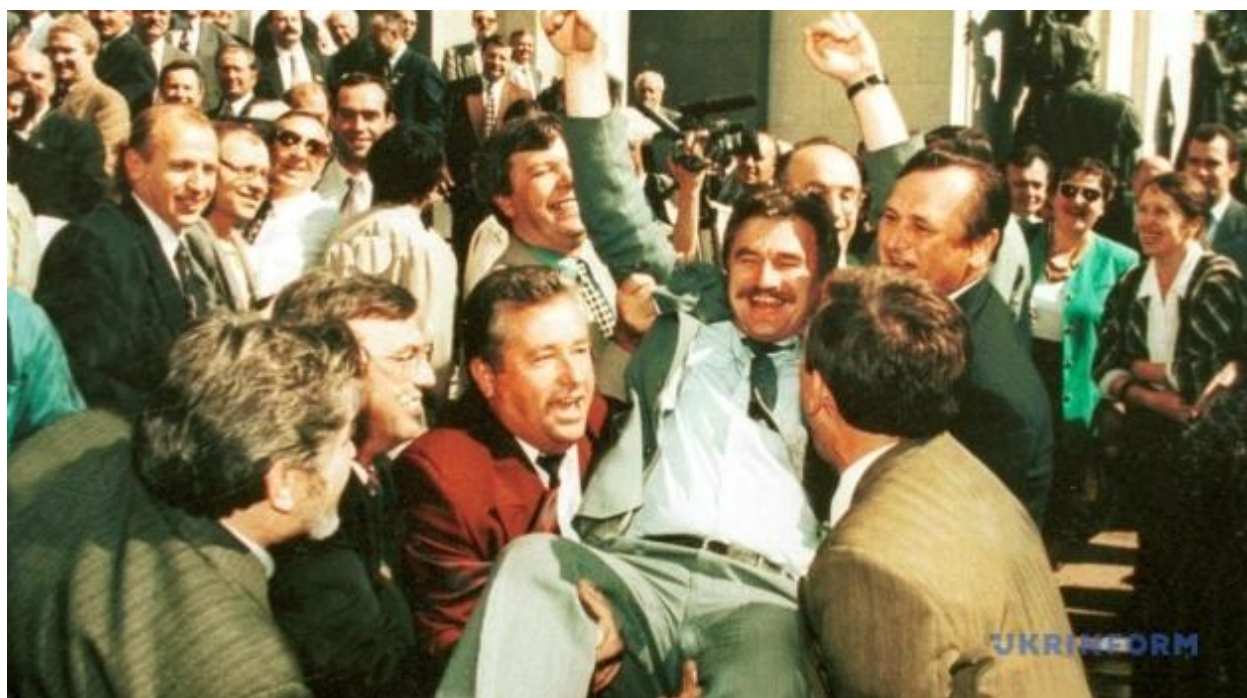
Михайло Сирота. Конституцію України прийнято. 28 червня 1996 р.