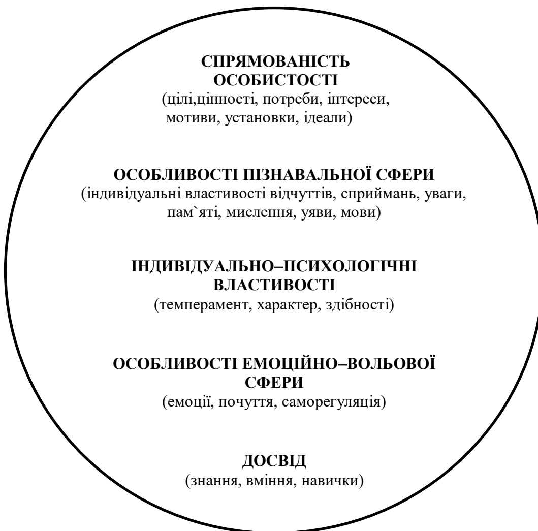
Схема 3.1 – Структура особистості за К.К.Платоновим

Всі підструктури взаємопов'язані і знаходяться в єдності, являють собою “Я” особистості. Дане “Я” керує всією діяльністю і відносинами з іншими.