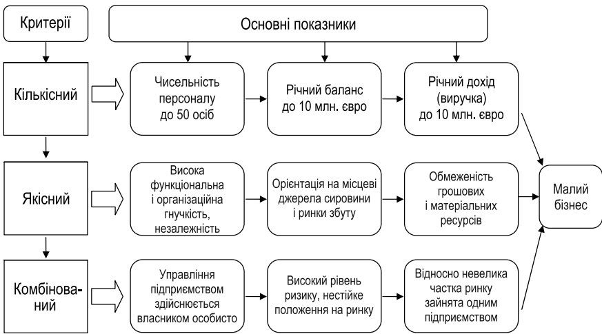
Рис.1. Основні критерії ідентифікації малих підприємств в Україні