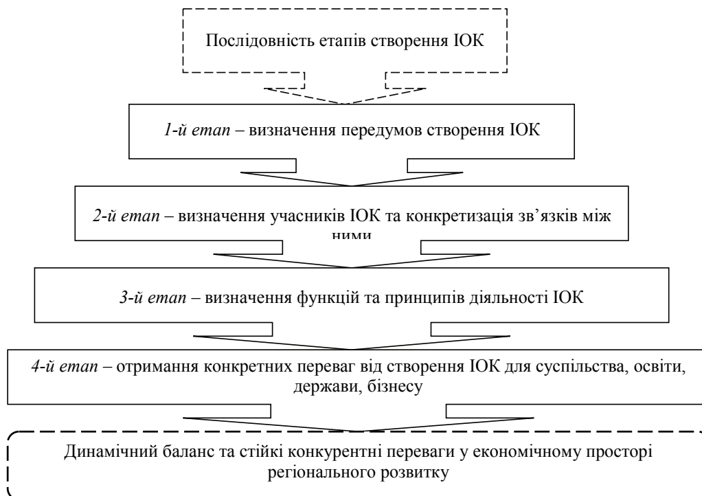
Рис. 2. Послідовність етапів створення ІОК на рівні регіону*

З початку ХХІ ст. Кабінетом Міністрів України було розроблено ряд проектів та розпоряджень нормативно-правових документів про необхідність кластеризації [11]. Проте так і не було створено офіційних підстав для інтенсивного запровадження кластерного підходу, що визначав би основоположні принципи формування та функціонування кластерів. Це призвело до того, що спроби самостійно ідентифікувати і структурувати кластери в окремих регіонах не приносять максимально можливого ефекту.