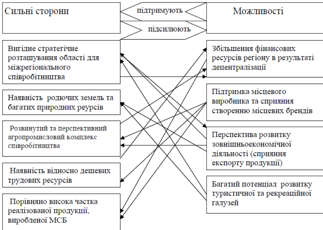
Рис. 1. Пріоритетні сильні сторони та можливості МСБ Черкаського регіону

можливості розвитку та розробляти напрями щодо їх підтримки. Це дасть змогу підсилити пріоритетні сильні сторони та у майбутньому перетворити можливості у сильні сторони.