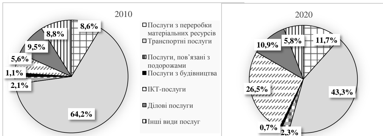
Рисунок 3 – Розподіл експорту послуг з України за видами у 2010 та 2020 рр.

Розглянемо детальніше структуру експорту українських послуг (рисунок 3).