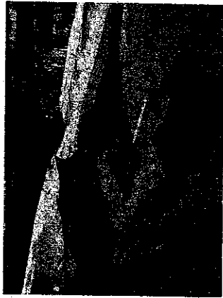
Тектонический разрыв на берегу Кодиака (Аляска, залив Кука) землетрясение 1964 г.