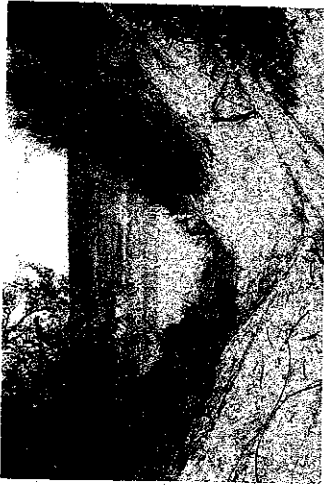
Калининград (Куршская коса)