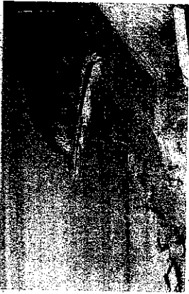
Берегозащита в районе Сочи