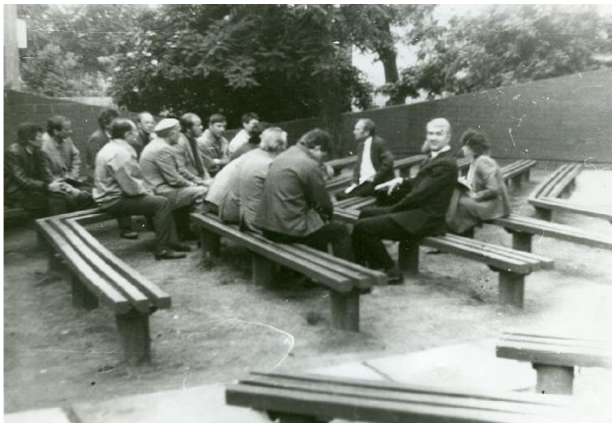
Професор Станіслав Губар проводить засідання оргкомітету по створенню Черкаської обласної організації Демократичної партії України. м. Черкаси (Дитячий парк). Червень 1990 р.

Починаючи з другої половини 1980-х рр., тобто у період «горбачовської перебудови і гласності», негативна оцінка в офіційній радянсько-партійній пресі була найкращою характеристикою людині. До професора С. І. Губаря потяглися пробуджені від тривалого радянського засилля люди. В цей період С. І. Губар стає у центрі національно-демократичного руху на Черкащині. Як відзначає потужний черкащанин-державник Михайло Вакуленко, «...цей невисокий, живий, спортивно підтягнутий, значно молодший за свій поважний уже вік чоловік запалював людей на мітингах-протестах, на установчих зборах, засіданнях патріотичних організацій. Люди жадібно, з вдячністю слухали його натхненні промови, науково чіткі формулювання, сміливо висловлені думки, в яких доказово розвінчувався антигуманний комуністичний режим, гаряче підтримували давно очікуване слово правди.