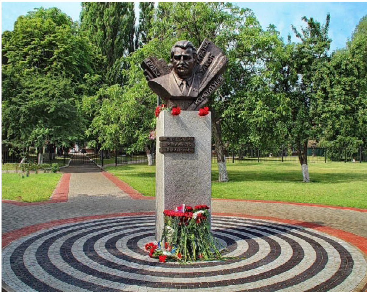
Пам'ятний знак М. Д. Сироті. Площа Знань ЧДТУ. Відкритий 27 червня 2017 р.

До 25-річчя з дня прийняття Основного Закону країни в Черкаському державному технологічному університеті вирішили увіковічити пам'ять одного з творців Конституції України, прийнятої 28 червня 1996 р., Михайла Сироти. Рішенням Вченої ради (протокол №13 від 22. 06. 2021 р.) ім'я видатного державотворця присвоєно навчальному корпусу ЧДТУ № 3. Саме в цьому корпусі Михайло Дмитрович навчався та працював, тут знаходиться меморіальна дошка пам'яті відомого політика. Вікна цього корпусу виходять на Площу Знань, де височіє погруддя Михайла Сироти.