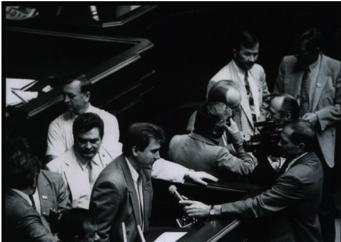
У вирі прийняття Конституції України. 1996 р.

«Залишилися найбільш важливі питання, пов'язані з мовою, з символікою, з Автономною Республікою Крим, приватною власністю на землю. До 5-ї години ми працювали в різних секціях, а о 5-й годині я став на трибуну Верховної Ради і не зійшов з неї до 9:20 ранку 28 числа. Було це надзвичайно драматичне засідання. Ніхто не спав. Не було багатьох урядовців, не було комуністів, які майже усі покинули залю. І дуже часто було, що залишалося 330 чоловік, а деякі комуністи, які залишалися, вийняли свої картки до голосування. 302 особи, 301 – усе висіло на волосочку. Багато було провокацій, коли спеціально збурення робили. Кричали: «Йдемо звідси!». Доводилося кричати: «Люди, що ви робите? Одумайтеся!».