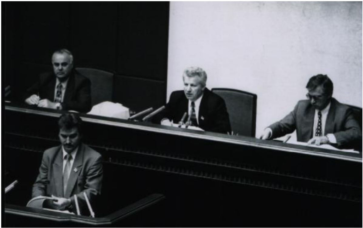
У вирі прийняття Конституції України. 1996 р.

Було й так, що я тримався за трибуну обома руками, а на моїх плечах чоловік 5-10 висіли, шпурляли один одного, били. Це була боротьба добра і зла, нечистих сил і Божої світлої сили. Як викладач я використав звичний прийом. Стоячи на трибуні, я не бачив облич, бачив лише чорну силу, яка кипіла ненавистю. Виходячи на трибуну, я хрестив тричі залу поглядом, а не рукою, і читав про себе «Отче наш». Після того нікому не вдалося вивести мене з рівноваги.