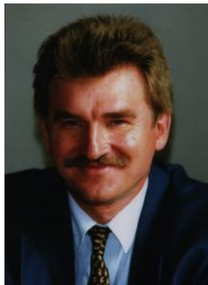
Сирота Михайло Дмитрович

Щороку 28 червня, у День Конституції України, ми згадуємо Михайла Дмитровича Сироту, якого нарекли – і це народне визнання! – «батьком української Конституції». У день ухвалення Конституції України народний депутат України Михайло Дмитрович Сирота упродовж 15 годин і 20 хвилин за трибуною Верховної Ради України відстоював права та обов'язки громадян України, прописані в новому основному законі держави, за що й отримав почесне ім'я «батька української Конституції» [1, с. 449].