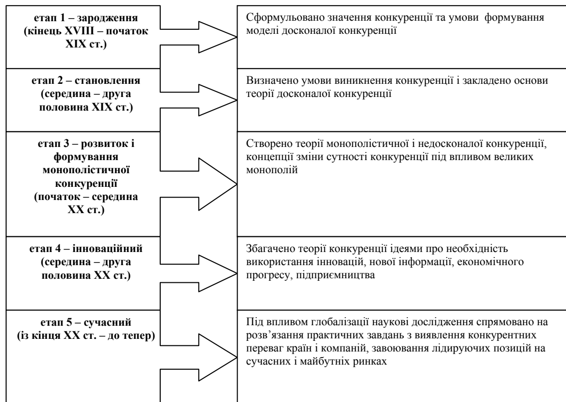
Рис. 1. Етапи еволюції теорії конкуренції та визначення їх внеску у ключові положення економічної теорії

О. Ю. Юданов стверджує, що ринкова конкуренція – це боротьба фірм за обмежений обсяг платоспроможного попиту споживачів, що ведеться ними на доступних сегментах ринку [7].