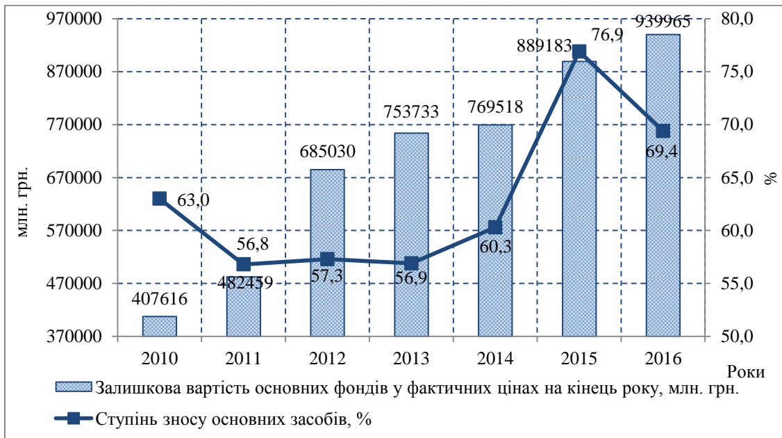
Рис. 2 Динаміка залишкової вартості основних фондів у фактичних цінах на кінець року та ступеня зносу основних фондів промислових підприємств України протягом 2010-2016 рр.*

Одночасно протягом всього періоду дослідження щорічно зростала залишкова вартість основних фондів промислових підприємств, причому у 2012 та 2015 рр. спостерігалось найбільше збільшення її розміру, рис. 2. Водночас всі означені процеси не дозволили кардинальним чином вплинути на зменшення ступеня зносу основних засобів промислових підприємств України, який у 2016 р. становив 69,4%, що є неприпустимо високим рівнем.