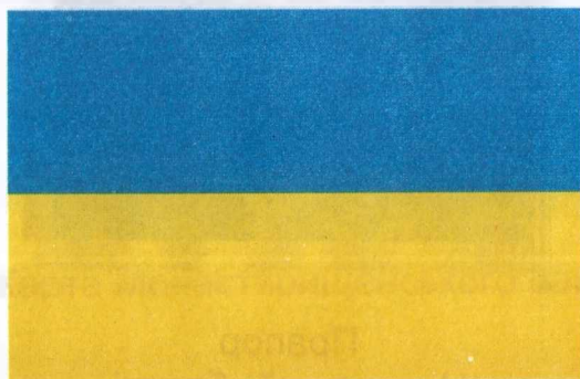
Державний Прапор України

започаткована в рік 10-ї річниці незалежності України і присвячується 50-річчю утворення Черкаської області – складової і невід’ємної частини Української держави