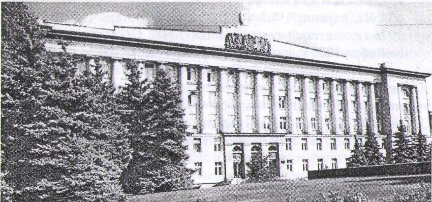
Здание Черкасской областной государственной администрации и областного совета