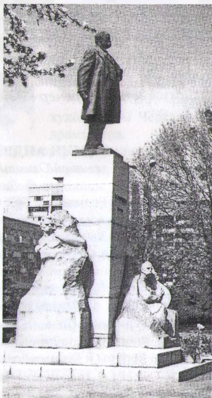
Памятник Тарасу Шевченко в городе Черкассы

Жизнеописание известных земляков имеет важное значение, поскольку жизненный путь каждого из них является реальным примером гражданина, который олицетворяет патриотизм, преданность и честность в служении своему народу.