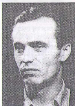
В. А. Симоненко

Умер 14 декабря 1963 г. Его именем названа улица в Черкассах и областная библиотека для юношества.