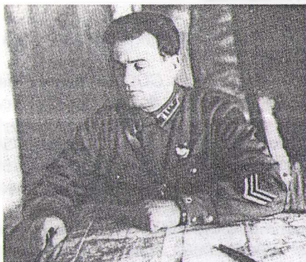
И.Д. Черняховский за рабочей картой. 1941 г.