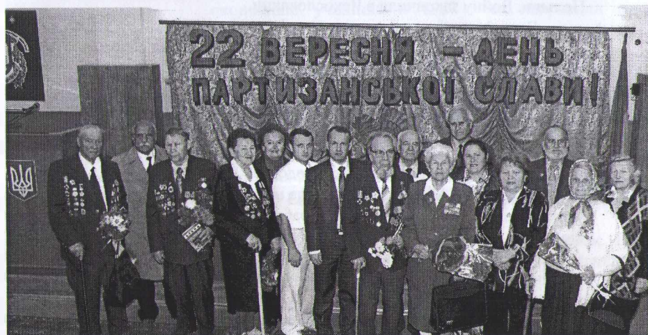
День партизантской славы Украины в Черкасском государственном технологическом университете. 19 сентября 2007 г.