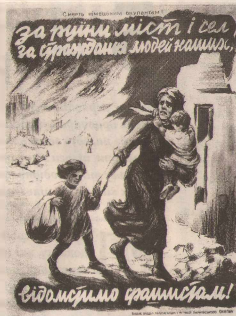
Плакати часів війни

Ще жевріли заграви боїв, а в Черкасах та області розпочалась відбудова господарств. У містах і селах відновлювали роботу державні органи. Вже в січні-лютому 1944 р. почали давати продукцію Черкаська тютюнова фабрика, деревообробний комбінат, механічний та ковальський цехи рафінадного, основні цехи консервного заводів, вальня фабрика, Уманський ремонтний завод, Золотоніський промкомбінат, верстатобудівний завод і залізнична майстерня в місті Корсуні та інші під-