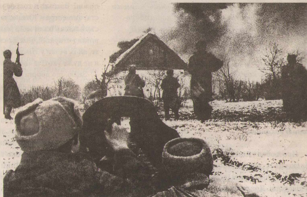
Бої на підступах до міста Корсуня. Лютий 1944 р.

Першою заповіддю загарбників було винищення носіїв комуністичної та на-