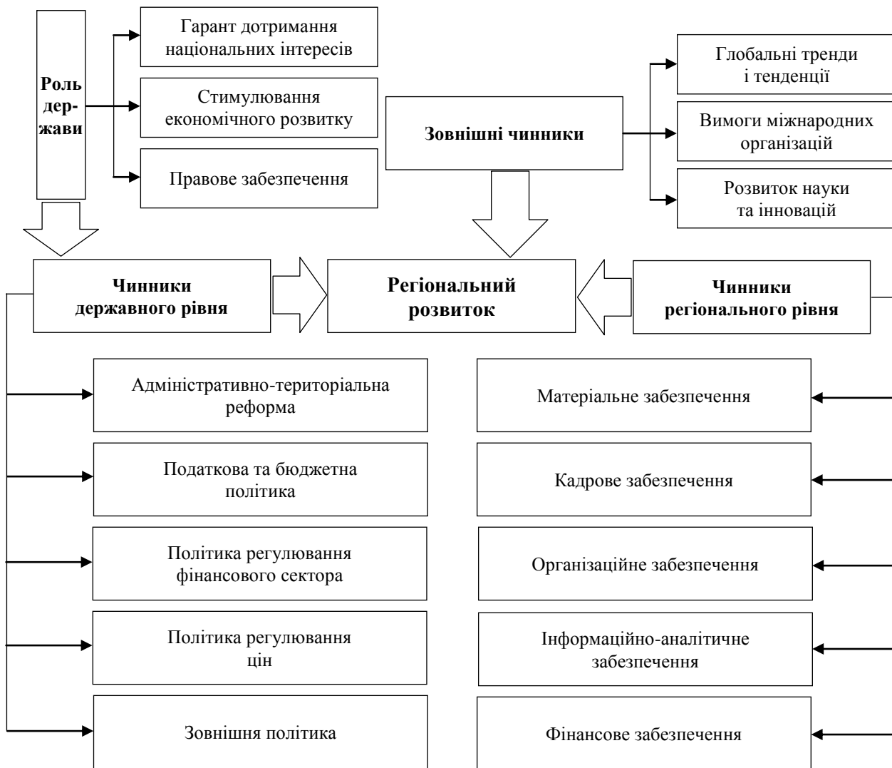
Рисунок 1. Чинники впливу на регіональний розвиток

розв’язання проблемних питань логістики та транспортної інфраструктури; розв’язання проблемних питань енергопостачання [10].