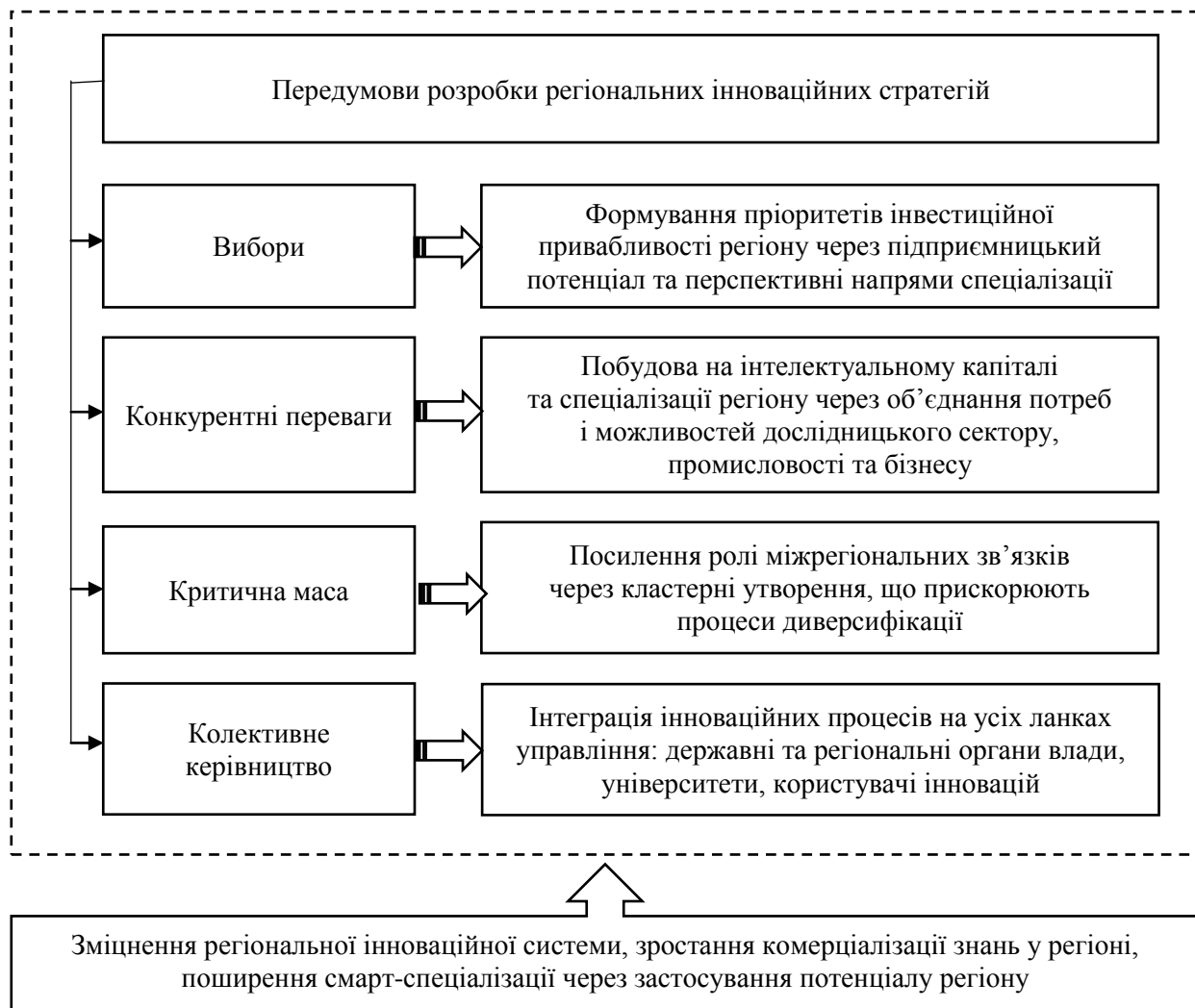
Рисунок 3. Інтерпретація основних критеріїв сучасних регіональних інноваційних стратегій

відображають положення Європейської комісії щодо інноваційних пріоритетів та розвитку смарт-спеціалізації. Такі стратегії мають базуватися на чотирьох основних елементах, основний зміст яких відображено на рисунку 3.