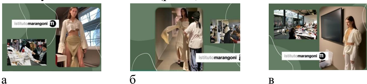
Рисунок 1 — Фрагменти презентації із доповіді про стажування в Інституті Марангоні

Так, здобувачеві вищої освіти випала нагода зануритися у атмосферу високого дизайну в Інституті Марангоні (Istituto Marangoni) — відомому навчальному закладі з довгою історією успіху в галузі моди та дизайну. Здобувач вищої освіти визнає, що досвід роботи як моделі з Istituto Marangoni є незабутнім і цінним для її кар'єри, бо дизайнери одягу втілюючи свої проєкти приміряли та коректували на моделі свої розробки та охоче ділилися своїми професійними секретами, ідеями та задумами. Так перебуваючи, певною мірою, в середині проєктного процесу створення одягу та спостерігаючи за його розвитком, вона удосконалювала свої професійні навички, отримала корисні знайомства та збільшила впевненість у своїх можливостях (рис. 1).