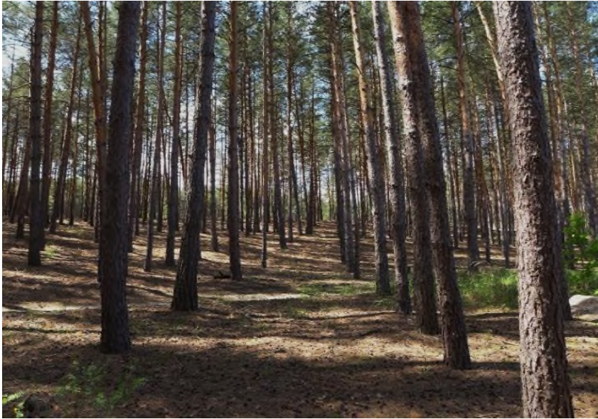
Fot. 6. Drzewostany sosnowe sztucznego pochodzenia (powierzchnia nr 4) na piaskach Przytiasmyńskich.

tworzą się tutaj skupienia porostów naziemnych i epifitycznych. Charakteryzuje taki typ boru także całkowity brak odnowienia sosny.