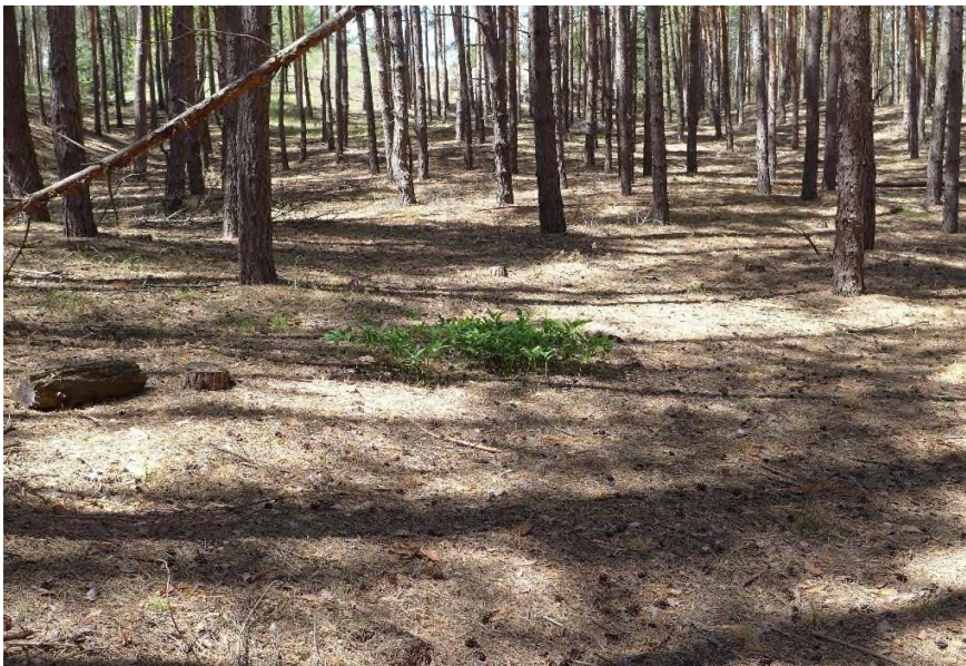
Fot. 7. Drzewostany sosnowe sztucznego pochodzenia (powierzchnia nr 10) na piaskach Przytiasmyńskich.