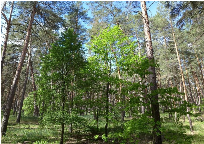
Fot. 2. Bory pochodzenia naturalnego (powierzchnia nr 1).

Nie występuje tutaj zwarta warstwa mchu, ale tylko mozaikowe grupy Dicranum scoparium Hedw., Pleurozium schreberi Mitt., Polytrichum commune Hedw., P. juniperinum Hedw. oraz epiksylne mchy Hypnum cupressiforme Hedw. Rzadko występują porosty - na pniach sosny Hypogymnia physodes (L.) (Nyl.), na glebie Cladonia gracilis (L.) Willd. Ciekawym zjawiskiem są tutaj kurtyny Peltigera canina (L.) Willd. Na powierzchni badawczej nr 1 odnotowano naturalne odnowienie sosny w ilości 300 szt. siewek na ha, co daje nadzieję na naturalną reprodukcję drzewostanu.