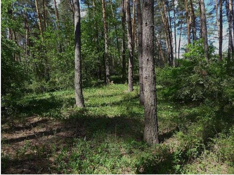
Fot. 3. Bory pochodzenia naturalnego (powierzchnia nr 2) (rezerwat Guszczewo)