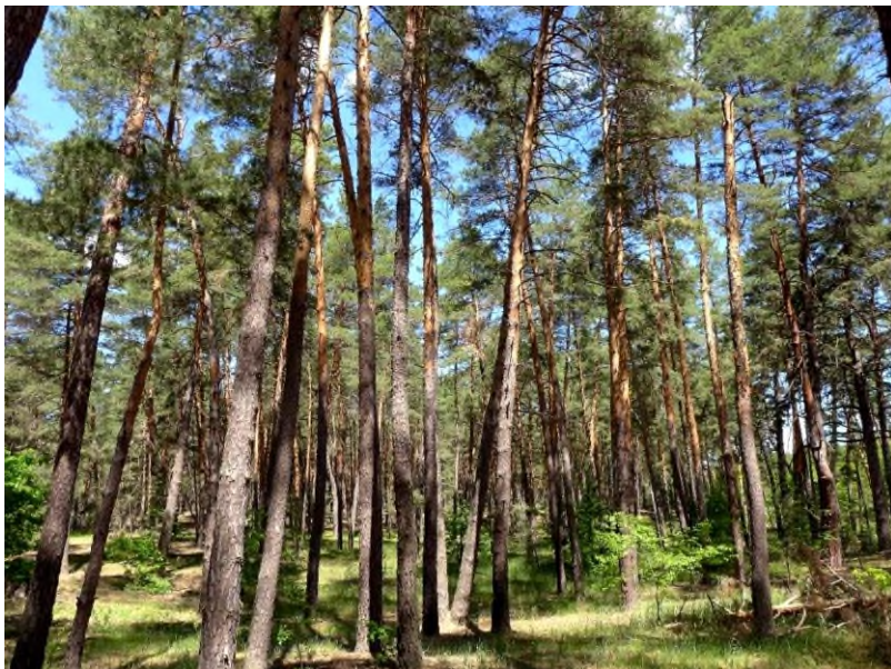
Fot. 5. Bory pochodzenia naturalnego (powierzchnia nr 8).

Inne typy fitocenotyczne prezentowane przez bory sztucznego pochodzenia są prawie jednowarstwowe i charakteryzują się regularnymi rzędami sosny oraz dużą liczbą gatunków roślin synantropijnych. Stwierdzono tutaj obecność 32 gatunków roślin wyższych.