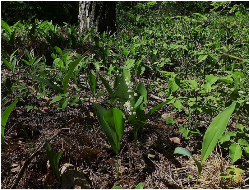
Fot. 4. Convallaria majalis L. w naturalnych borach rezerwatu Guszczewo (powierzchnia nr 2).