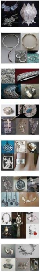
Рисунок Ж.1 – Зразок графічної частини кваліфікаційної роботи магістра на тему «Художньо-конструктивні особливості ювелірних виробів із срібла». Спеціалізація – Промисловий дизайн

Монтування Монтування – це процес виготовлення ювелірних виробів шляхом використання монтування металу. Ця техніка дозволяє створювати вироби з певною текстурою та формою, які часто використовуються в ювелірному мистецтві.