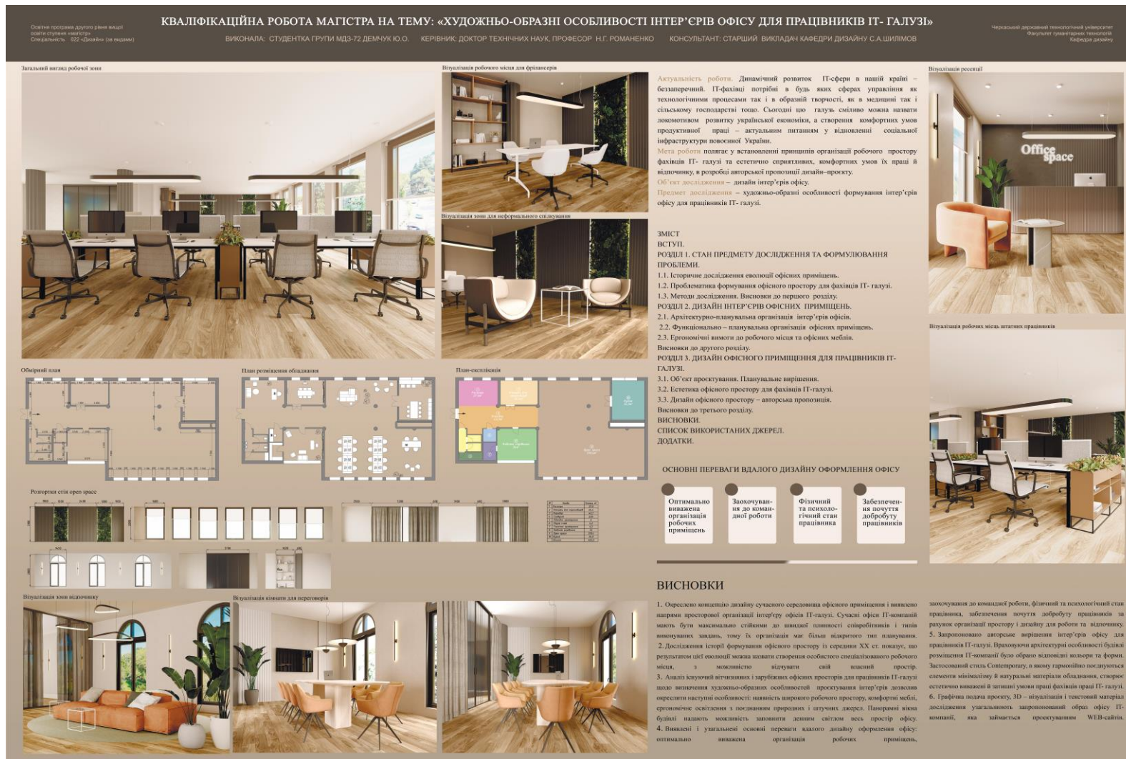
Рисунок К.1 – Зразок графічної частини кваліфікаційної роботи магістра на тему «Художньо-образні особливості інтер'єрів офісу для працівників ІТ-галузі». Спеціалізація – Дизайн середовища