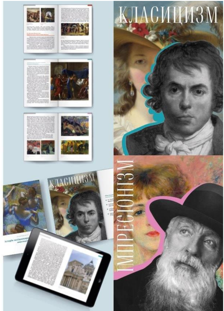
Рисунок И.1 – Зразок графічної частини кваліфікаційної роботи магістра на тему «Проектно-художні засоби дизайну інтерактивного підручника». Спеціалізація – Графічний дизайн