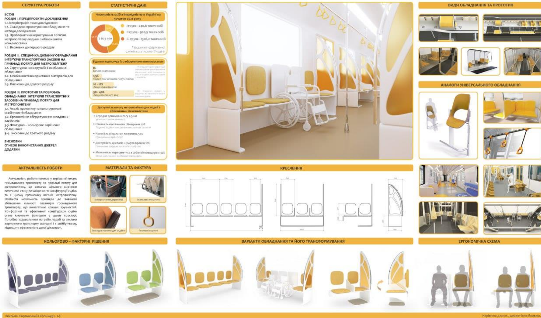
Рисунок Ж.3 – Зразок графічної частини кваліфікаційної роботи магістра на тему «Специфіка обладнання інтер'єрів транспортних засобів на прикладі потягу для метрополітену». Спеціалізація – Промисловий дизайн.