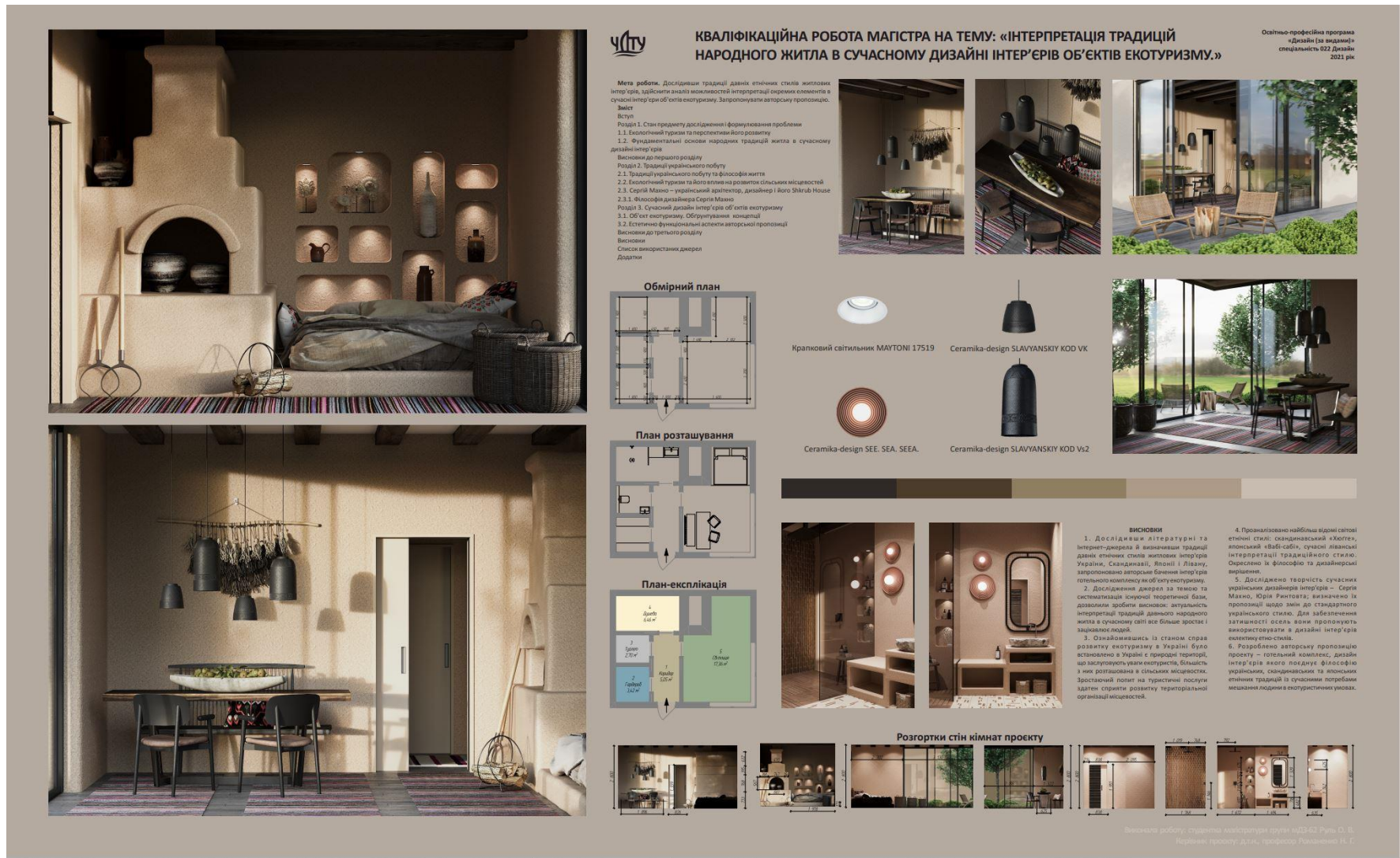
Рисунок К.3 – Зразок графічної частини кваліфікаційної роботи магістра на тему «Інтерпретація традицій народного житла в сучасному дизайні інтер'єрів об'єктів екотуризму». Спеціалізація – Дизайн середовища