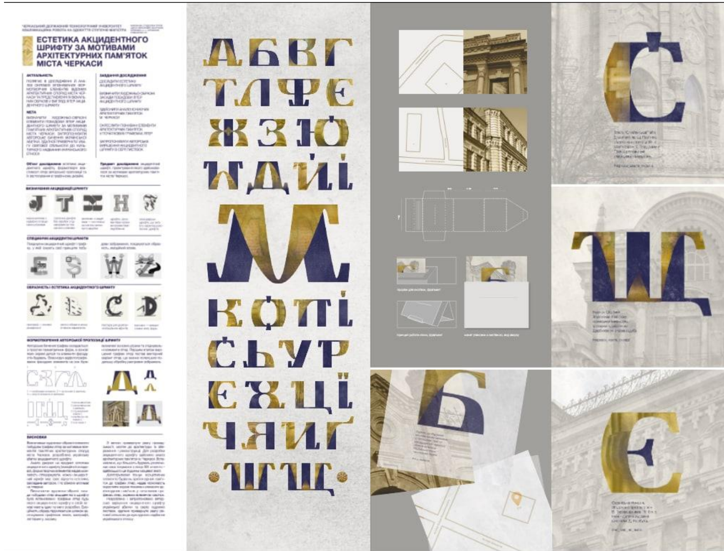
Рисунок И.3 – Зразок графічної частини кваліфікаційної роботи магістра на тему «Естетика акцидентного шрифту за мотивами архітектурних пам’яток міста Черкаси». Спеціалізація – Графічний дизайн