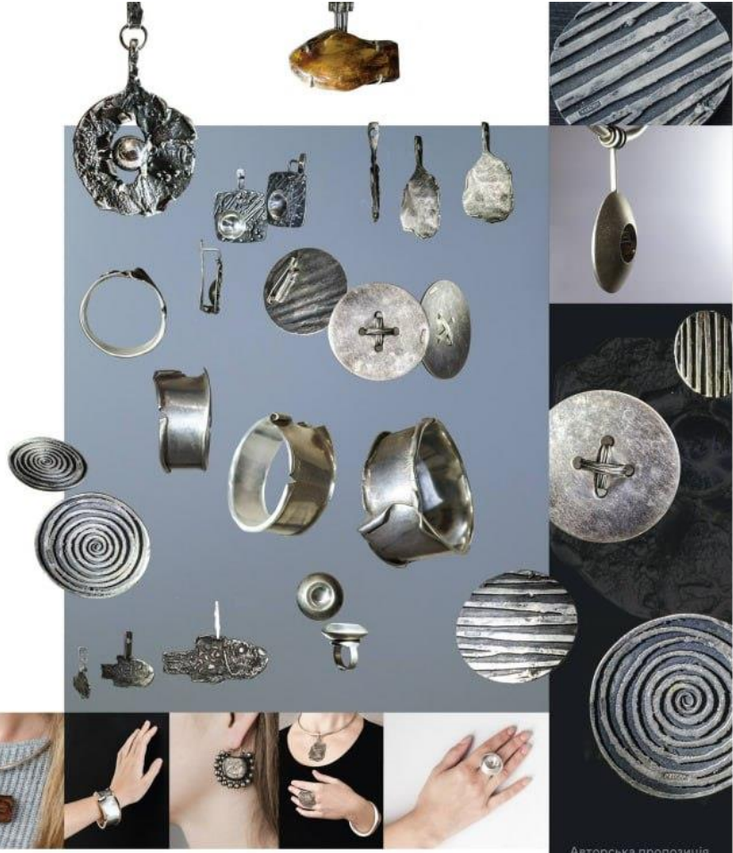
Авторська пролозіція «Фактурна рівновага»

Художньо-конструктивні особливості Філігрань Філігрань – це техніка виготовлення ювелірних виробів, що полягає в створенні тонких, витончених елементів з металу. Ця техніка дозволяє створювати складні, ажурні дизайни, які часто використовуються в ювелірному мистецтві.