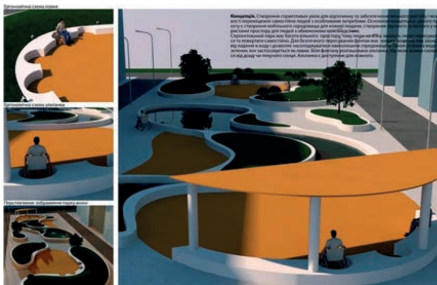
Рис. 3. Проект паркової зони для людей з інвалідністю. Автор: Єлизавета Іщенко. Керівники: І. Яковець, С. Шилімов. Черкаський державний технологічний університет, 2021.

Основною концепцією проекту «Дизайн-проект паркової зони для людей з інвалідністю» (рис. 3) є створення інклюзивного середовища для кожної людини та створення зручного і легкого у використанні простору для людей з інвалідністю.