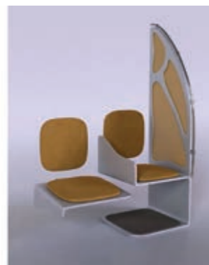
Рис. 1. Проект інклюзивного обладнання для громадського транспорту. Автор: Сергій Барвінський. Керівники: Н. Чугай, Р. Савісько. Черкаський державний технологічний університет, 2021.