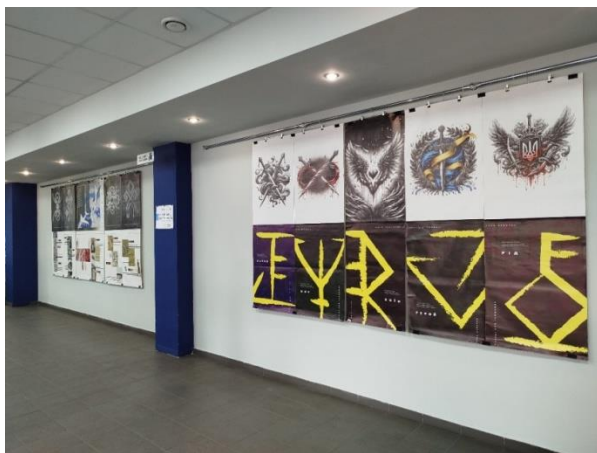
Рис. 1. Фрагмент експозиції мистецької акції ВОЛЬНАНОВА «Українська ідентичність: традиції та образи» до Дня Незалежності України, ЦНАП, м. Черкаси, Україна, 2024 https://design.chdtu.edu.ua/novosti/do-dnja-nezalezhnost-ukra-ni-u-cherkasko.html

Візуальні стереотипи швидко старіють, втрачають актуальність, задовнюються... Сучасний графічний дизайн є виробником нових візуальних стереотипів. Тому кафедра працює над проєктуванням, створенням нових символів та знаків. Відповідно, особливу увагу звернено на глибинні пласти культури, трипільські мотиви, руни, язичницькі слов'янські символи (рис. 1, 2).