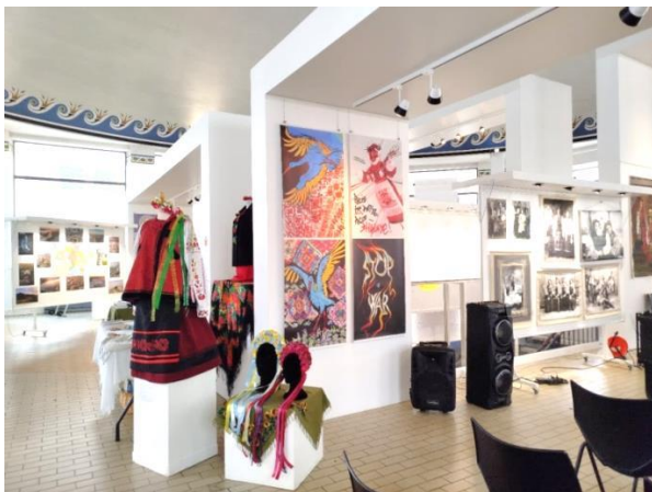
Рис. 3. Фрагменти експозиції «VOLNANOVA» у межах мистецького проєкту ART PARADIS, м. Лімож, Франція, 2024 https://design.chdtu.edu.ua/novosti/kafedra-dizainu-chdtu-predstavila-mistec.html