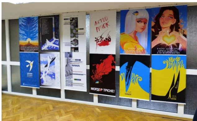
Рис. 2. Фрагмент експозиції мистецької акції VOLNANOVA у межах «DESIGN-ART-STUDY», Волинський національний університет ім.Л.Українки, м.Луцьк, Україна, 2024 https://design.chdту.edu.ua/novosti/-design-art-study-u-lucku-dizaineri-chdt.html

Одним із аспектів, простим і тим, що легко сприймається, стало звернення до знакових, відомих у світі персон. Оновлено та введено до масового візуального обігу образи постатей історичних, політичних, культурних діячів України, які так чи інакше вплинули на формування української державності.