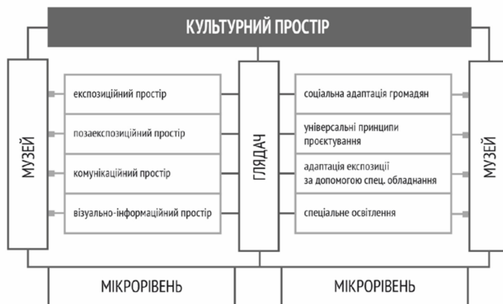
2. Структура культурного простору музею на мікрорівні [34, с. 79] з урахуванням інклюзивності