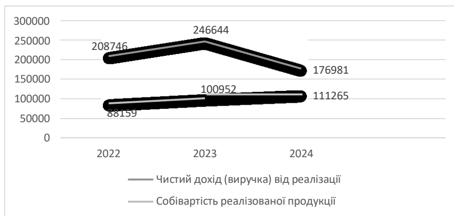
Рис. 2.3 Основні показники господарської діяльності ТОВ «Coral Travel» за 2022-2024 роки. Джерело: [43]

На рисунку 2.3 можна оглянути основні показники господарської діяльності підприємства за 2022-2024 роки у динаміці.