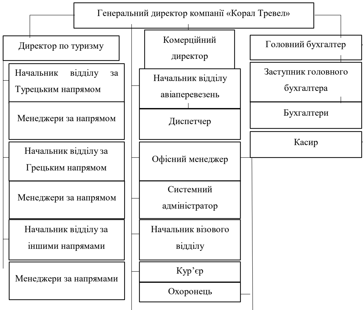
Рис. 2.2 Організаційна структура ТОВ «Coral Travel»