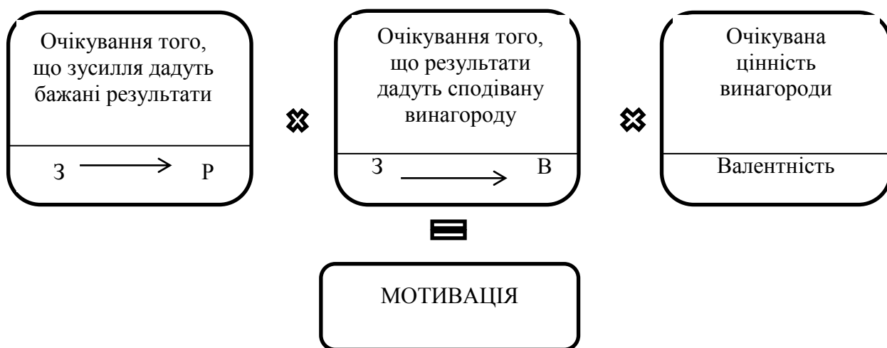
Рис.1. Модель мотивації

Приймаючи рішення з приводу того, що робити і які зусилля витратити, людина передусім має відповісти на запитання: навіщо треба це робити, що вона отримає внаслідок успішного виконання роботи. Модель мотивації за теорією очікувань представлена на рис.1.