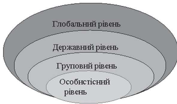
Рис.3.1. Схема чинників, які впливають на формування протестних настроїв

Виділення глобального рівня факторів узгоджується з тезою Х. Майалла, згідно з яким «в умовах глобалізації аналіз конфліктів повинен враховувати соціальний, регіональний і міжнародний контексти. Ми повинні розглядати як сприяють побудові світу фактори, так і фактори, що збільшують конфлікт на всіх рівнях, від насильницького початку до періоду після його дозволу» [9, с. 340]. Не залишає поза увагою зовнішній фактор у своїх роботах Т. Скокпол. Досліджуючи ключові для соціальних змін взаємодії між державними, економічними і соціальними структурами, вона приходять до висновку про те, що для встановлення причин революції корисно виділяти зовнішні суперечності як одні з найважливіших структурних умов революції. Зовнішні суперечності виявляються в невідповідності становищі даної держави на міжнародній арені, тиску іноземних держав. Особливу увагу дослідниця приділяє впливу міжнародного та всесвітньо-історичного контексту на внутрішні політичні конфлікти [2, с. 25]. Загалом, міжнародне оточення може або спонукати до революційних перетворень у цілих регіонах («Хвилі» демократизації (Хантінгтон), теорія «доміно», експорт революції (Троцький)) або сповільнювати їх (Геополітичні стратегії, доктрина Брежнєва).