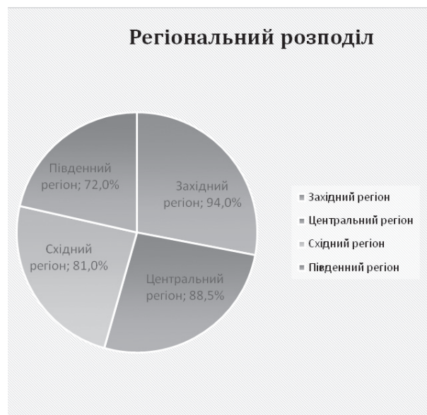
Мал. 1. Показники рівня патріотизму українського народу

З огляду на вищевказані результати з різних років, можна погодитися із думкою В. Кулика про те, що особливістю щодо України є несформованість та контраверсійність ідентичності. Вона була знівельована довгим часом