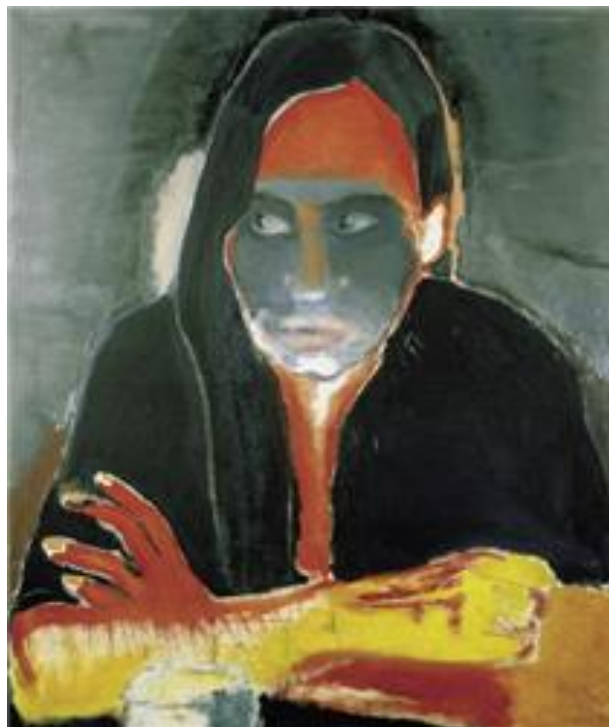
Додаток А. Рис. 7. Марлен Дюма. Genetiese Heimwee / Genetic Longing