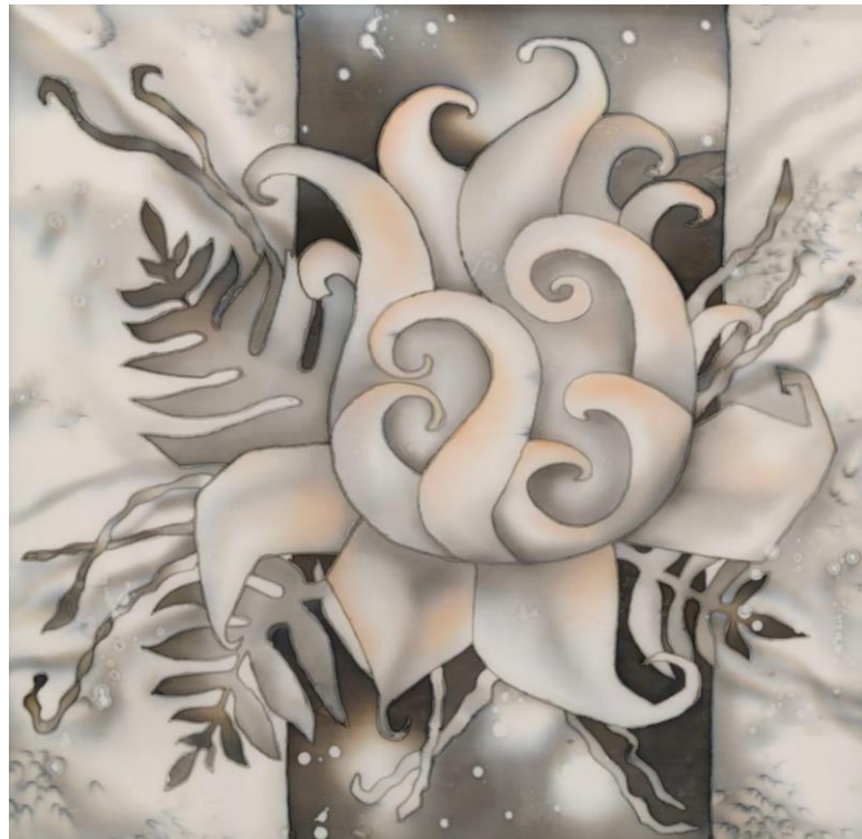
Додаток Б. Рис. 2 «Квітка папорті» (батик, 70x70) Євмененко Владислав, ДЗ-31