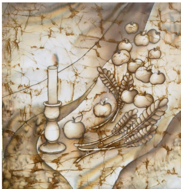
Додаток Б. Рис. 4 «Серпневий вечір» (батик, 70х70) Сіренко Поліна, ДЗ-31