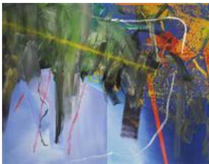
Додаток А. Рис. 4. Герхард Ріхтер. Clouds.