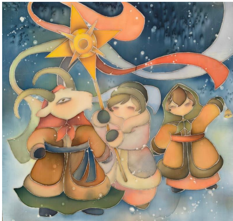
Додаток Б. Рис. 3 «Свят вечір» (батик, 70х70) Пустовіт Світлана, ДЗ-31