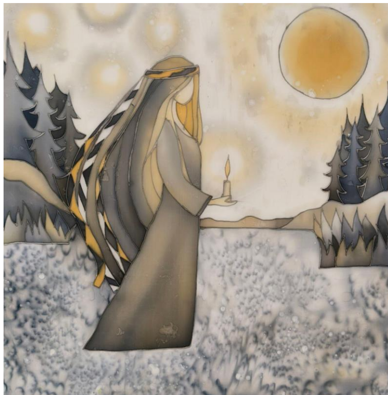
Додаток Б. Рис. 11 «Наворожі долю...» (батик, 70х70) Комірча Анастасія МГД-25