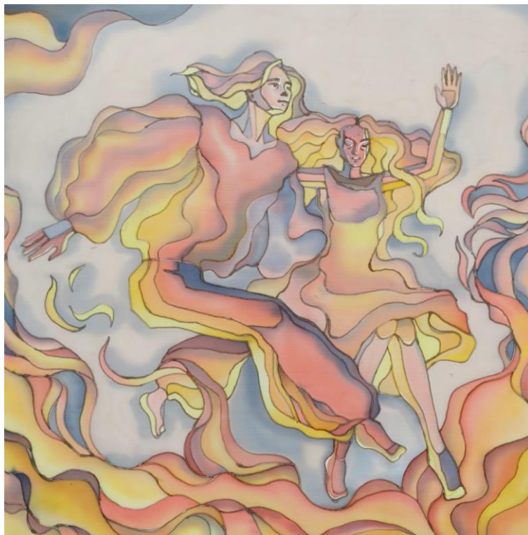
Додаток Б. Рис. 13 «Ті, що танцюють» (батик, 70x70) Липовець Сергій МГД-25