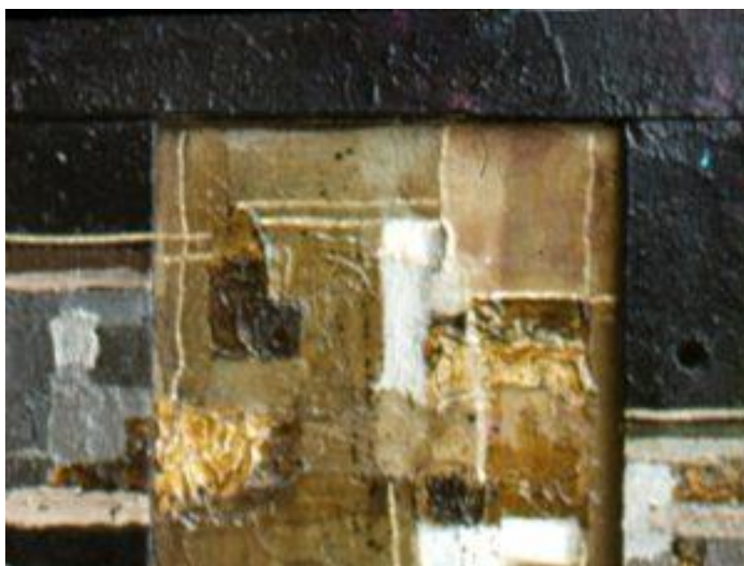
Додаток А. Рис. 6. Олександр Ройтбурд. Абстрактна композиція, оргаліт, змішана техніка.