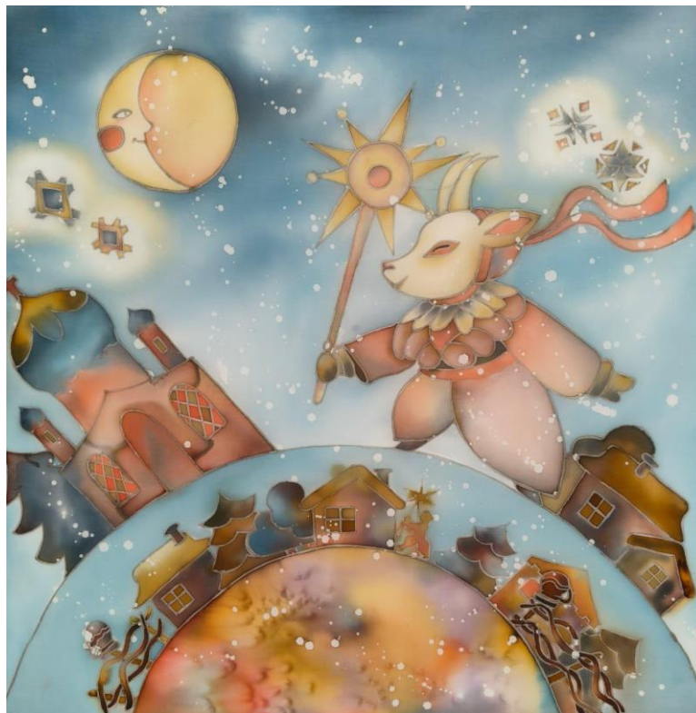
Додаток Б. Рис. 7 «Пробудження зорі» (батик, 70x70) Постіва Аліна, ДЗ-31