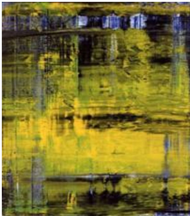
Додаток А. Рис.3. Герхард Ріхтер. Абстрактна картина