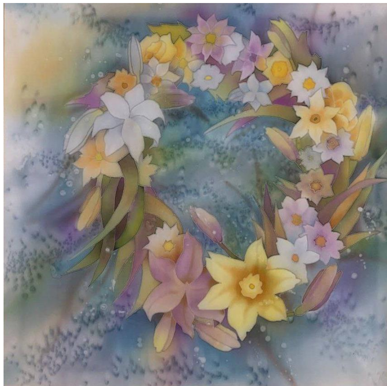
Додаток Б. Рис. 5 «Доля» (батик, 70х70) Гайдай Єлизавета, ДЗ-31