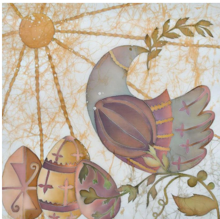
Додаток Б. Рис. 6 «Сонячні візерунки» (батик, 70х70) Коваленко Марія, ДЗ-31