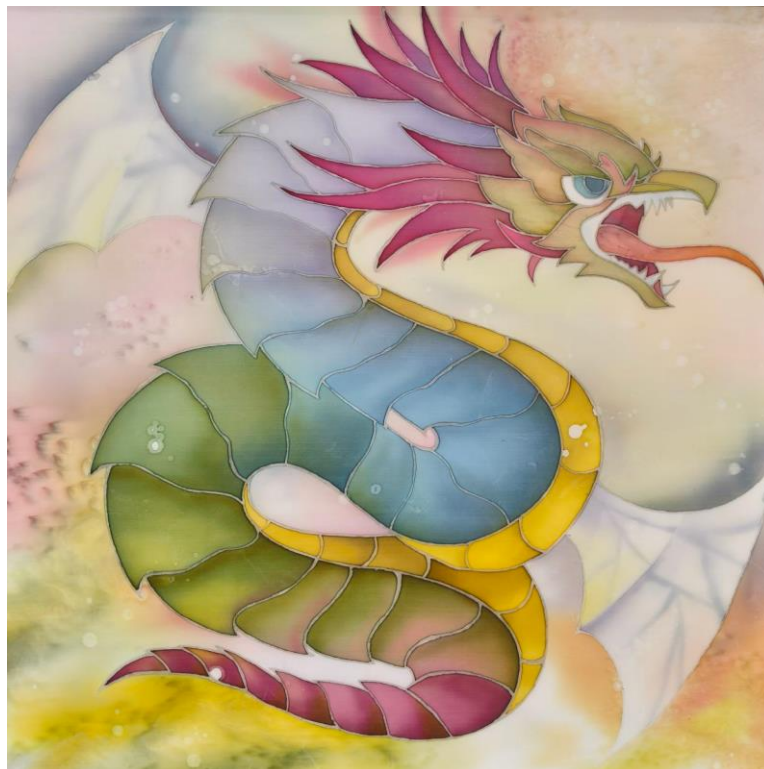
Додаток Б. Рис. 9 «Василіск» (батик, 70х70) Цвященко Ірина, ДЗ-31