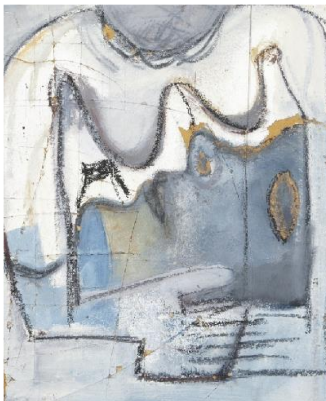
Додаток А. Рис. 8. Марлен Дюма. The Luxury of Tenderness