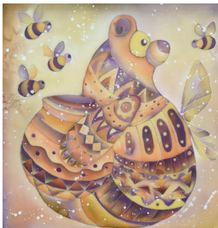
Додаток Б. Рис. 10 «» (батик, 70х70) Юсипенко Максим, ДЗ-31