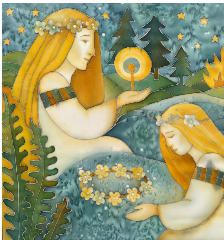
Додаток Б. Рис. 12 «Дівочі таємниці» (батик, 70х70) Степаненко (Манн) Анастасія, МГД-25