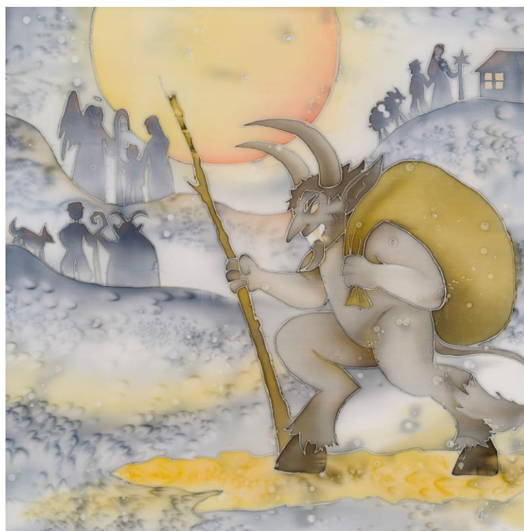
Додаток Б. Рис. 8 «Маланка» (батик, 70x70) Кокош Яна, ДЗ-31