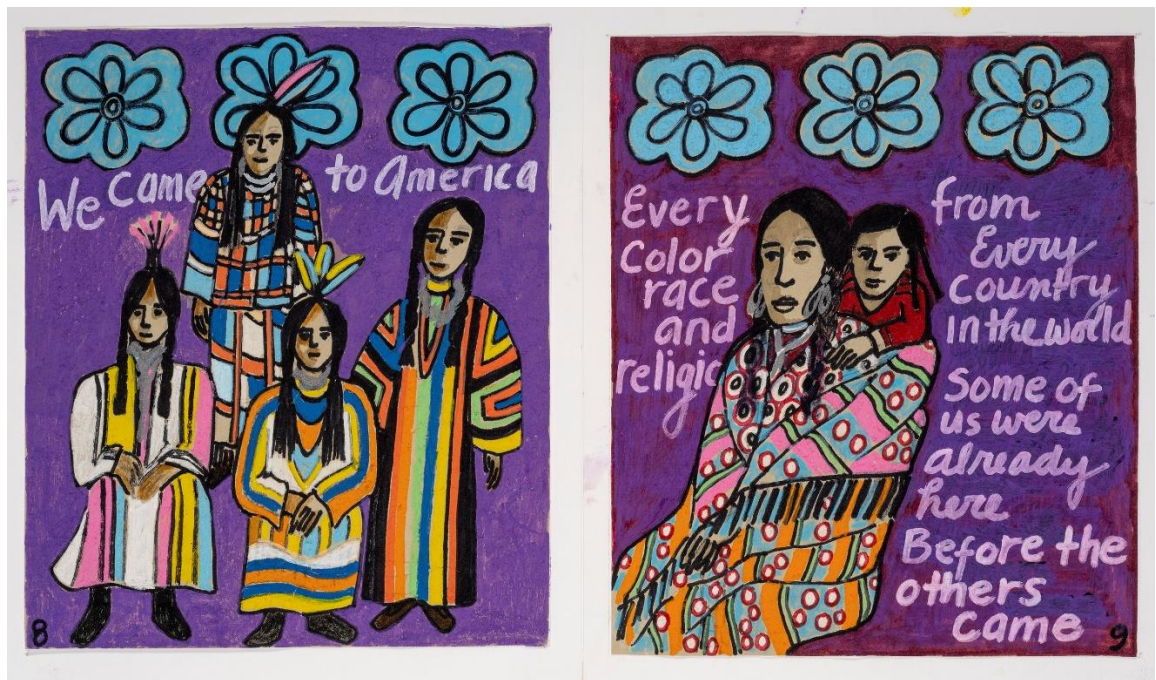
Додаток А. Рис.1. Фейт Рінголд (США) створює «story quilts», поєднуючи живопис і тканинні панно з яскраво вираженим соціальним меседжем.